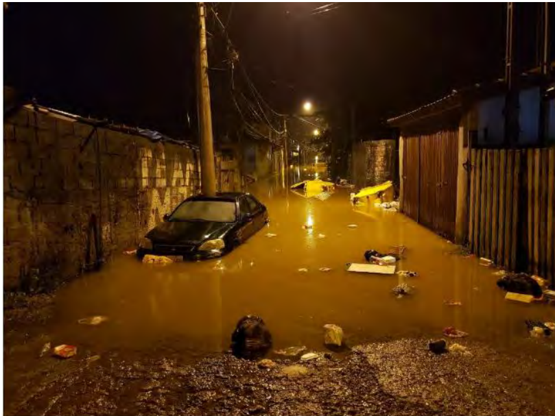
Chuva alaga ruas em São Sebastião

O órgão orienta os moradores de regiões de encosta e pedem que acionem as equipes.