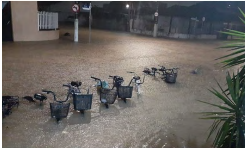
Chuva deixou diversos pontos da região alagados

As fortes chuvas que atingiram o Litoral Norte provocaram alagamentos e queda de barreiras na região. Em São Sebastião, uma árvore de grande porte bloqueou a rodovia Rio-Santos, entre Boiçucanga e Maresias, na noite desta segunda-feira (3). Em Caraguatatuba, há vários pontos intransitáveis e a rodovia dos Tamoios está interdita há mais de 15 horas por segurança.