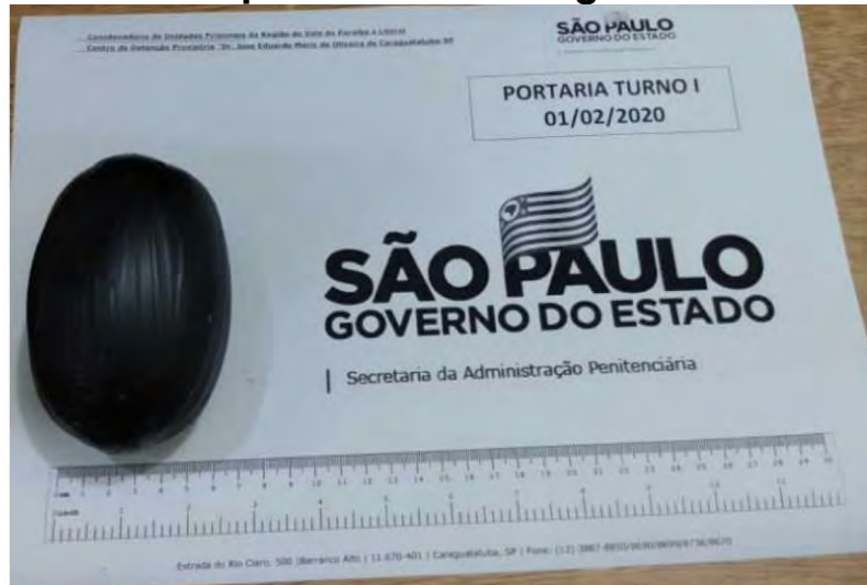
Droga foi apreendida pela SAP

Uma jovem de 19 anos foi flagrada com droga no corpo enquanto tentava visitar seu companheiro neste sábado (1º) no CDP (Centro de Detenção Provisória) "Dr. José Eduardo Mariz de Oliveira", em Caraguatatuba.