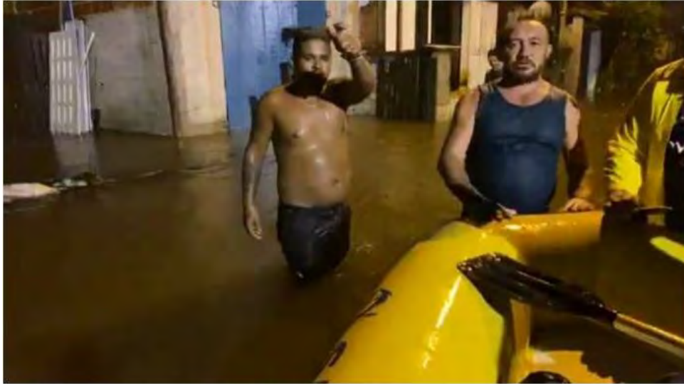
Ocorrências segue em andamento na Baleia Verde

Rio-Santos está bloqueada em Maresias e diversos bairros ficaram embaixo d'água em Caraguatatuba