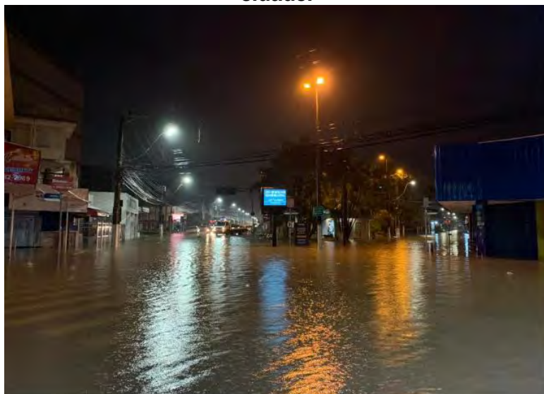
Chuva deixou ruas alagadas em Caraguatatuba

Apesar dos estragos, a Defesa Civil informou que não há desabrigados na cidade.