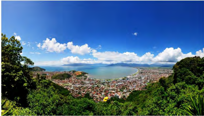
Caraguá. Meio milhão de turistas