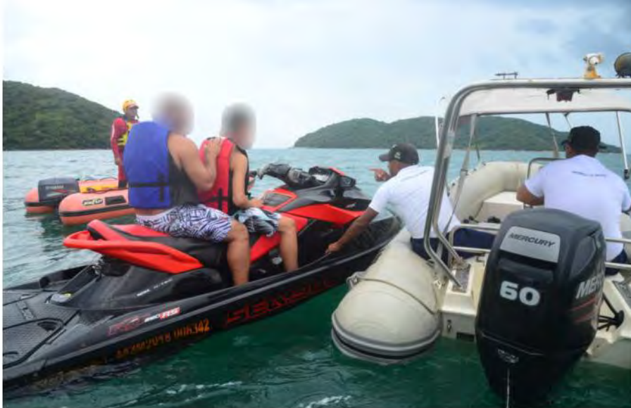
Agentes da Marinha durante fiscalização

A ação contou também com o apoio do Grupamento de Bombeiros Marítimos