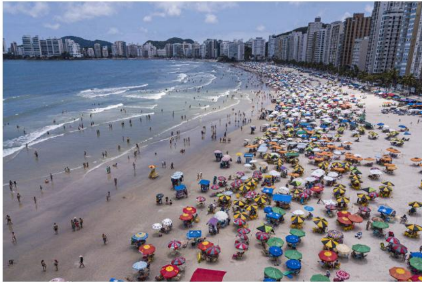
Movimentação na Praia das Pitangueiras, no Guarujá

O preço médio do metro quadrado na região em junho de 2019 (dado mais recente disponível) era de R$ 5,8 mil -valor estável em relação ao ano passado. Considerando todo o período de julho de 2016 a junho de 2019, um apartamento de 2 dormitórios econômico saiu em média por R$ 208 mil. Já uma unidade mais luxuosa, de 4 ou mais dormitórios, custa em média R$ 1,5 milhão.