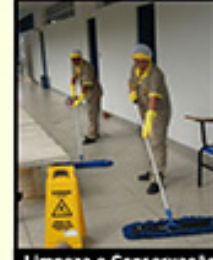
Limpeza e Conservação