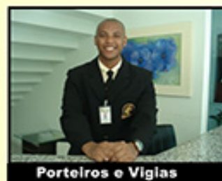
Porteiros e Vigias