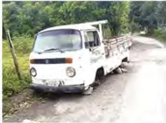
Os veículos recolhidos em Caraguatatuba aguardam para ir a leilão

Segundo a Secretaria de Mobilidade, no ano passado foram registradas cerca de 340 demandas, das quais 150 se transformaram em recolha ao pátio credenciado que fica no Tinga, na região central. O restante, os proprietários retiraram os veículos dos locais onde estavam há mais de 15 dias. Esses veículos aguardam para ir a leilão.