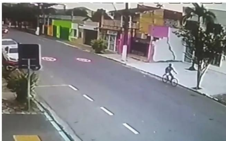
Imagens de câmeras mostram suspeito de ter ateadado fogo no carro da prefeitura

As imagens mostram um homem circulando pelas ruas no entorno da Prefeitura de bicicleta por volta das 14h28 e portando um galão que sugere ser combustível. Pouco depois, imagens mostram que ele força a entrada no veículo, joga o galão e atea fogo, fugindo rapidamente do local. A ação não durou 30 segundos.