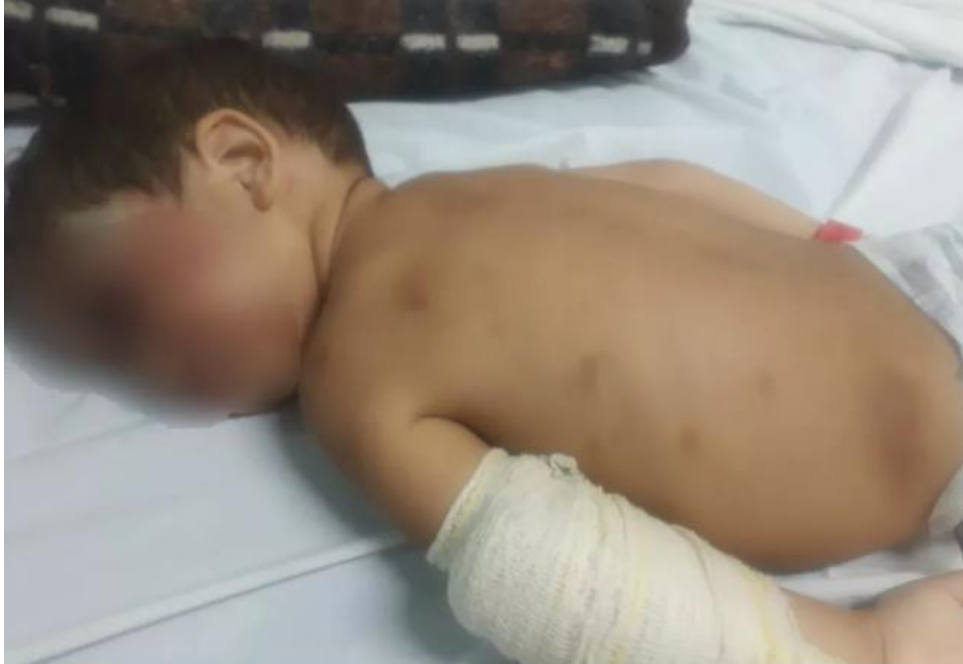
Bebê está internado no hospital Stella Maris em Caraguatatuba

Suspeita é de que criança tenha sido agredida por padrasto enquanto a mãe trabalhava. Caso foi registrado como maus tratos e polícia investiga.