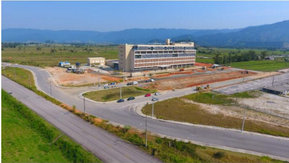
Previsão de entrega da unidade hospitalar é para março deste ano

Essa conquista é resultado de um investimento de R$ 188 milhões do Programa Saúde em Ação, parceria da Secretaria de Estado da Saúde com o Banco Interamericano de Desenvolvimento.