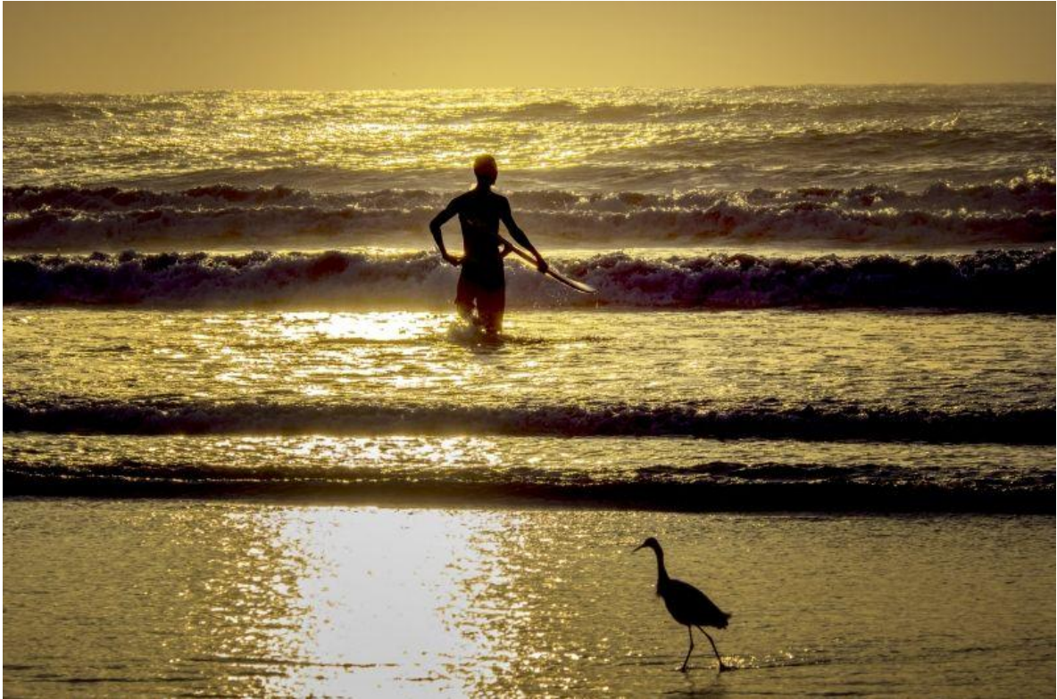
Praia da Enseada - Bertioga