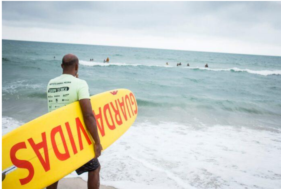
Projeto Salva Surf acontece em todo litoral paulista

Em São Sebastião foram 22 participantes e próxima ação acontece no sábado (21) em Caraguá