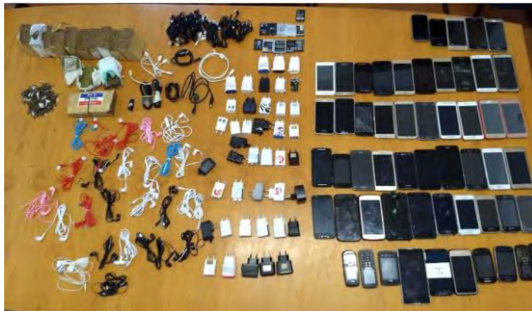
Drogas e celulares apreendidos em penitenciária de Tremembé

Outras ocorrências foram registradas em Caraguá e Taubaté também neste sábado