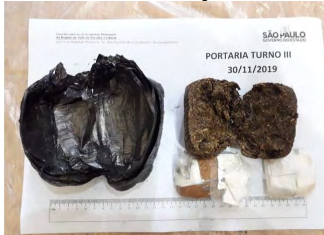
O flagrante aconteceu na visita de sábado

Visitante tentou entrar com mais de 100 gramas de cocaína e maconha