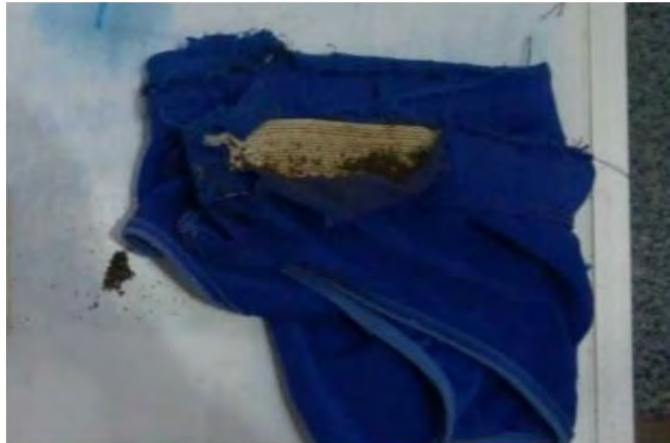
Droga escondida na calcinha de visitante do CDP de Taubaté

delegacias das cidades e tiveram seus nomes suspensos do rol de visitas da SAP.