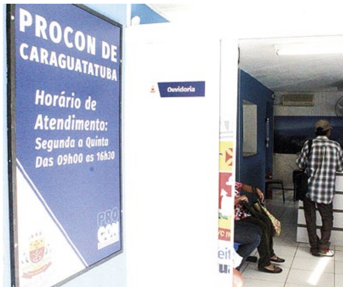
O atendimento no Procon da cidade é realizado de segunda a quinta-feira, das 9h às 16h30

O Procon de Caraguatatuba atende na avenida Frei Pacífico Wagner, 908, no centro. Os telefones são (12) 3897-8282 e (12) 3897-8279. (GSP)