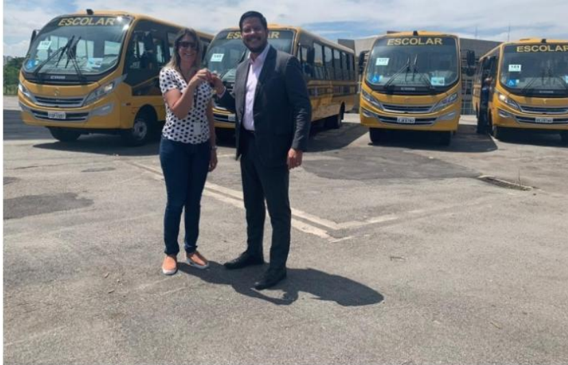
Segundo prefeito, os ônibus servirão para atender principalmente os estudantes da Região Sul | Foto: Divulgação/PMC

O prefeito de Caraguatatuba, Aguilar Junior, recebeu nesta quinta-feira (10/10), as chaves de quatro novos ônibus que serão integrados à frota do transporte escolar da cidade. A entrega oficial ocorreu em São Paulo e contou com a presença da equipe do Setor de Transportes da Secretaria de Educação.