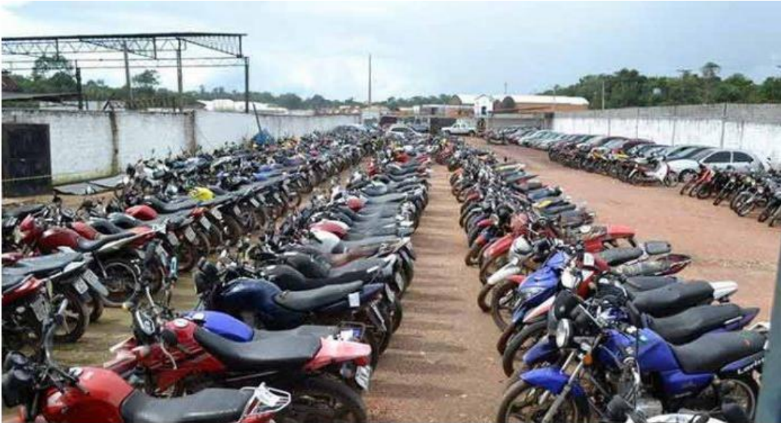
O leilão acontece na terça-feira (8), pela Internet

Carros e motos foram removidos dos proprietários por conta de infrações de trânsito