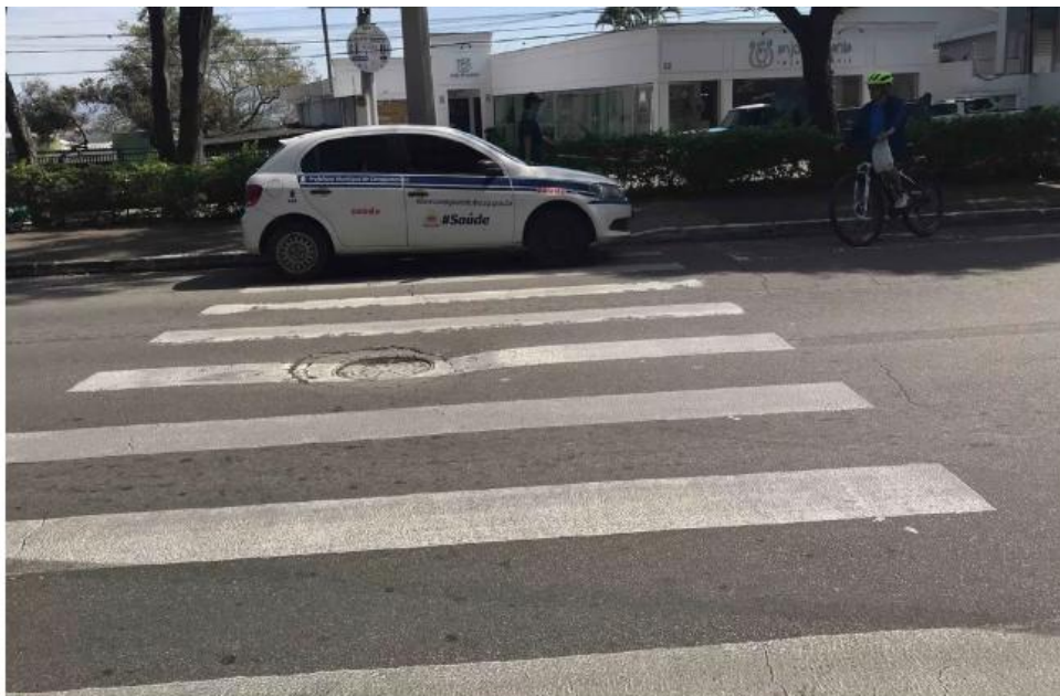
Carro oficial da prefeitura de Caraguá estaciona em faixa de pedestres em São José.

De acordo com o site do Detran, a infração para estacionar em cima da faixa de pedestre considerada grave e o valor da multa é de R$ 195,23.