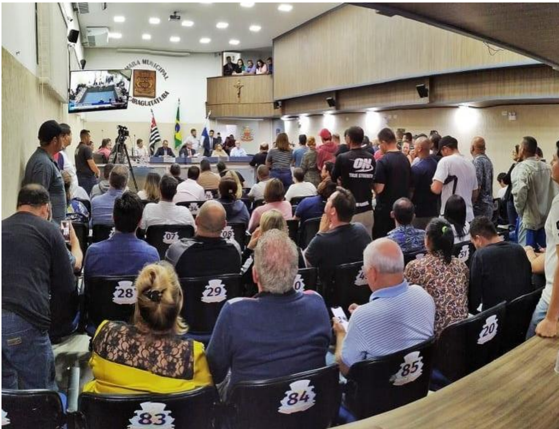
Votação do empréstimo levou a noite toda na Câmara Municipal

Após brigas na Justiça, dinheiro deve ser liberado pela Caixa Econômica Federal para projetos nas áreas de educação, saúde, esportes, infraestrutura, saneamento básico, lazer e social