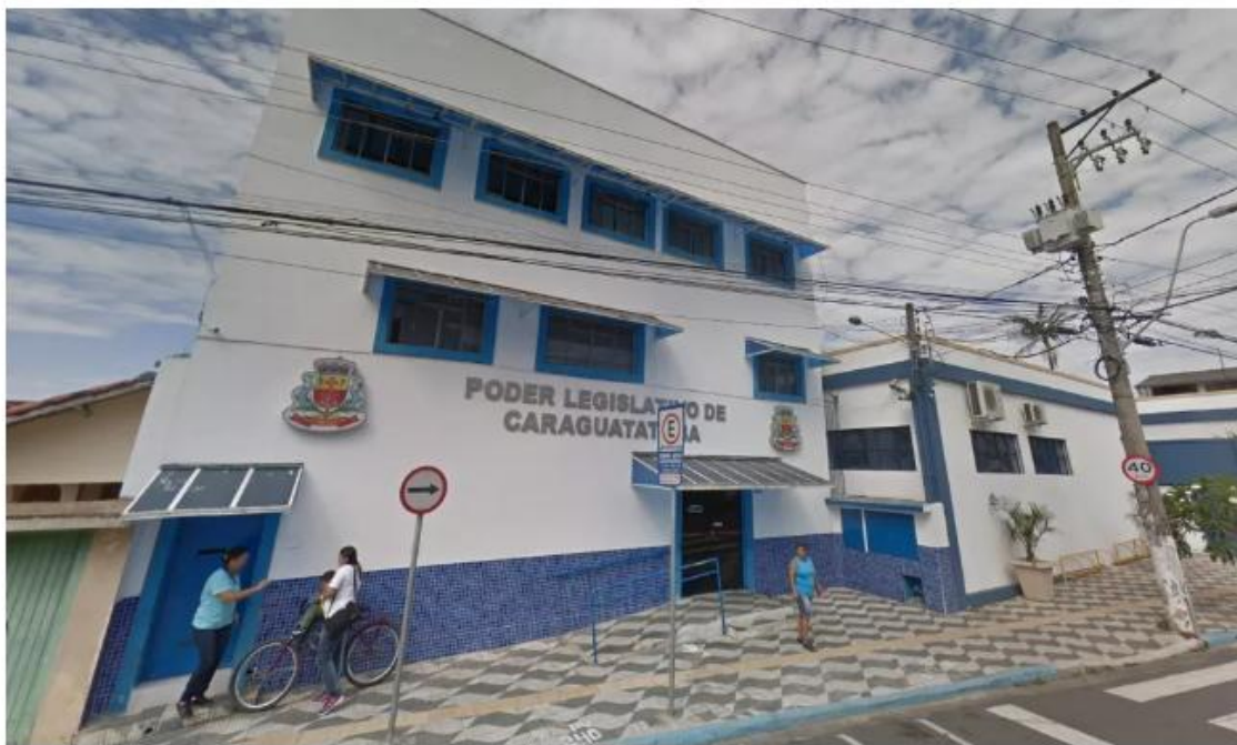
Câmara de Caraguá aprovou empréstimo milionário

Projeto é alvo de um impasse entre a presidência e oposição e foi aprovado pela Câmara na noite de terça-feira (1º) após ser colocado em votação em meio à disputa na Justiça.