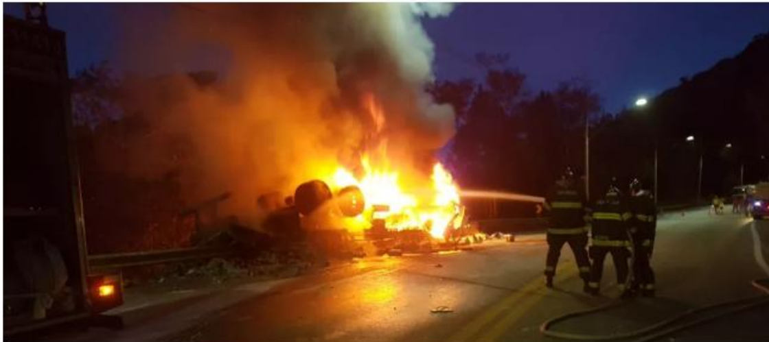
Caminhão de tintas pega fogo na Tamoios na noite desta quarta-feira (2)

Duas pessoas ficaram feridas e foram socorridas pelo Corpo de Bombeiros. Rodovia foi interditada nos dois sentidos por cerca de 1 hora. Às 19h30 foi liberada em sistema 'pare e siga'.