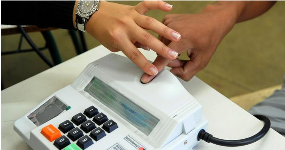
Eleitor votando em urna com biometria.

Cidadãos que precisam do cadastramento biométrico para as próximas eleições podem procurar o Poupatempo Caraguatatuba até o dia 31 de outubro para realizar o atendimento.