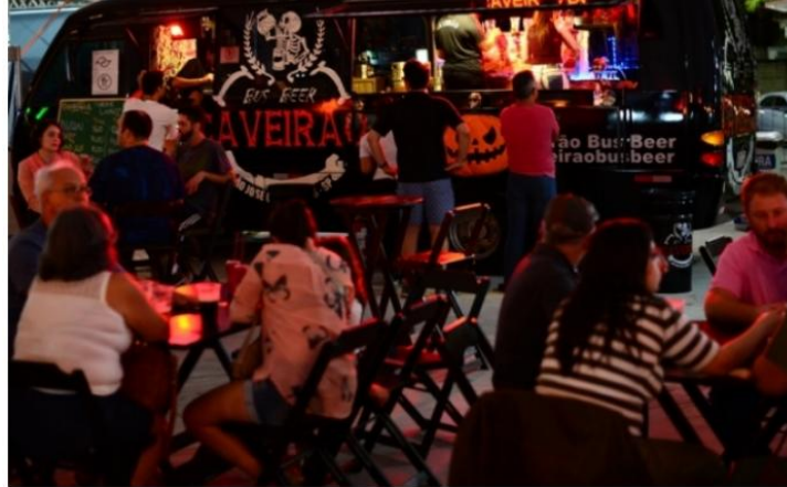
Festival será nos dias 17 e 18 de outubro

A Prefeitura de Caraguatatuba, por meio da Secretaria de Turismo (Setur), confirma a participação de 47 comerciantes no 3º Caraguá Beer Festival, que será de 17 a 20 de outubro de 2019, na Praça da Cultura, e deve reunir um público de cerca de 15 mil pessoas.