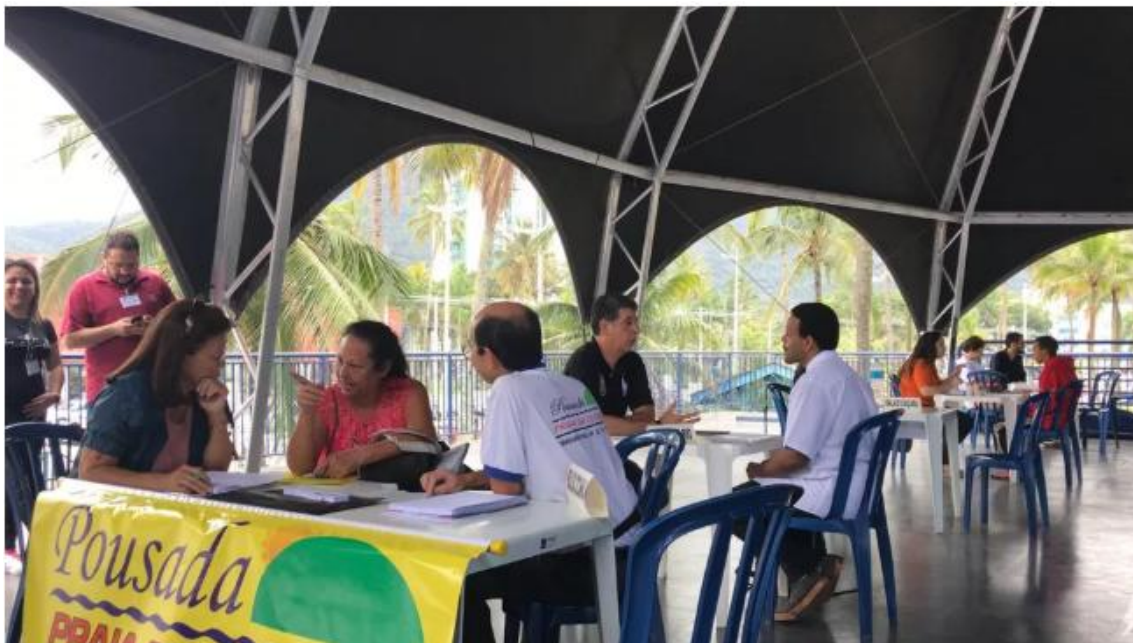
Entrevistas de emprego são realizadas durante todo o dia — Foto: Pedro Melo/TV Vanguarda

De acordo com dados do Cadastro Geral de Empregados e Desempregados (Caged), de janeiro a agosto deste ano a cidade fechou 316 postos de empregos formais. Apesar disso, a cidade vem em recuperação já que em agosto teve bom desempenho com abertura de 160 postos de trabalho.