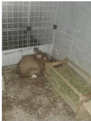
Coelhos se alimentam com feno

“Por ser um animal exótico, não é qualquer veterinário que cuida, a consulta para um coelho chega a ser o triplo do que cobram para cães e gatos. Observo se todos estão fazendo cocô e xixi, se estão tristes e quietinhos. Tenho uma atualmente que está com problema na visão e todo dia eu coloco soro fisiológico e limpo os olhinhos dela, além de colocar remédio.