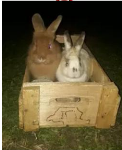
Bichinhos vivem em caixotes

As pessoas oferecem dinheiro pelos coelhos, mas Raquel não consegue se desfazer de nenhum deles. Conhece todos pelo nome e observa diariamente o comportamento de cada um.