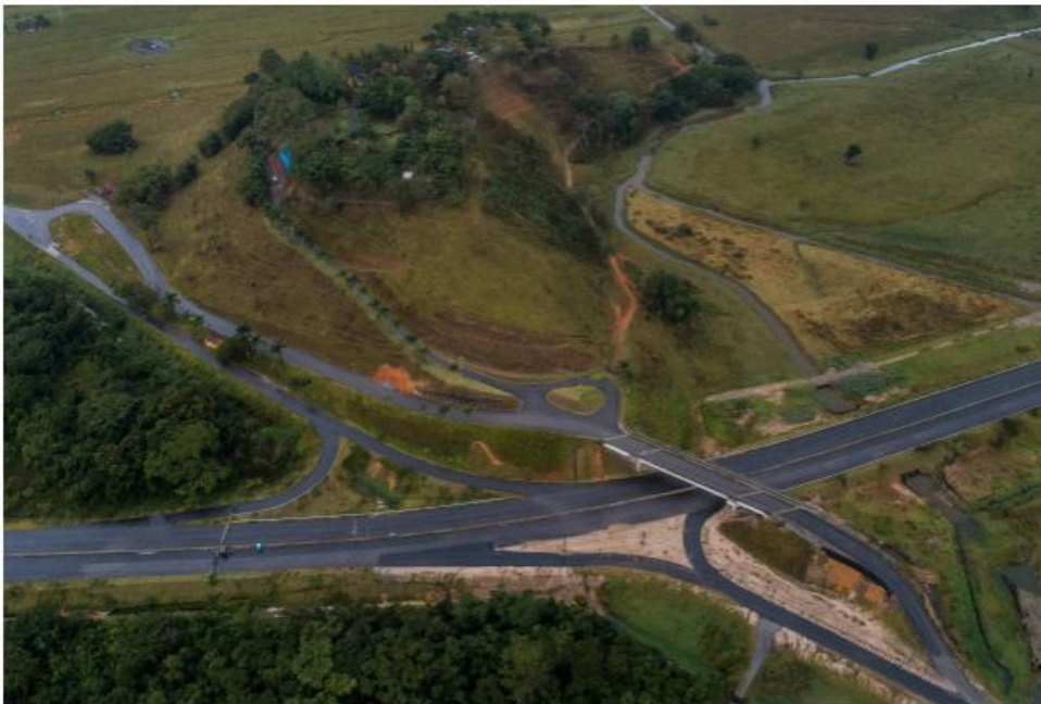
Viaduto que a Dersa construiu ao custo de R$ 3 milhões, em Caraguatatuba (SP)

A gestão do ex-governador Geraldo Alckmin (PSDB), que comandou o estado até o ano passado, gastou cerca de R$ 3 milhões em um viaduto que serve apenas para ligar uma estrada a uma fazenda particular. Ou seja, a obra não tem nenhuma utilidade pública.