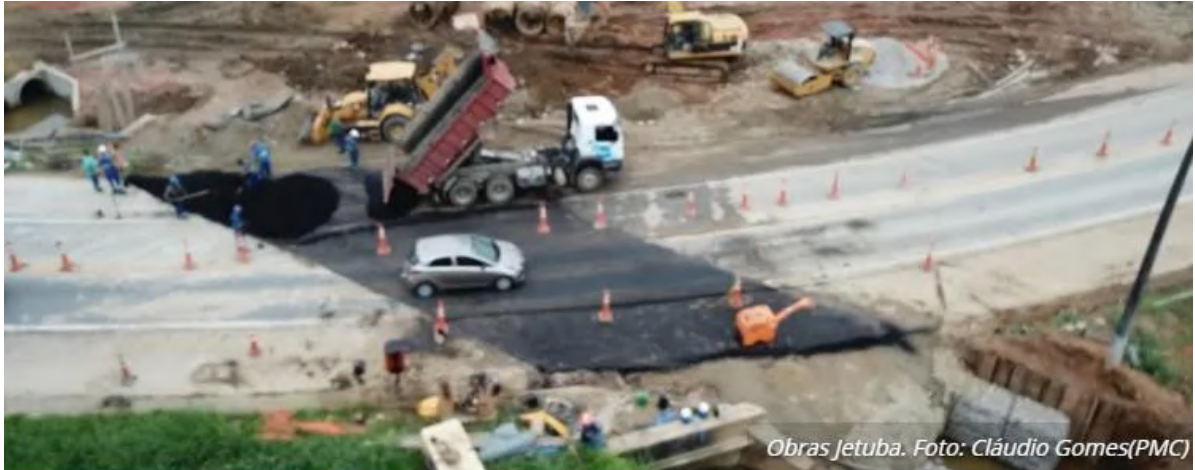
Obras Jetuba.

A Prefeitura de Caraguatatuba deve finalizar nesta sexta-feira (25) a repavimentação do corte realizado na Rodovia SP-55 (Rio-Santos), no bairro Jetuba, para as obras de drenagem. A empresa terceirizada contratada realiza a instalação de aduelas no local.