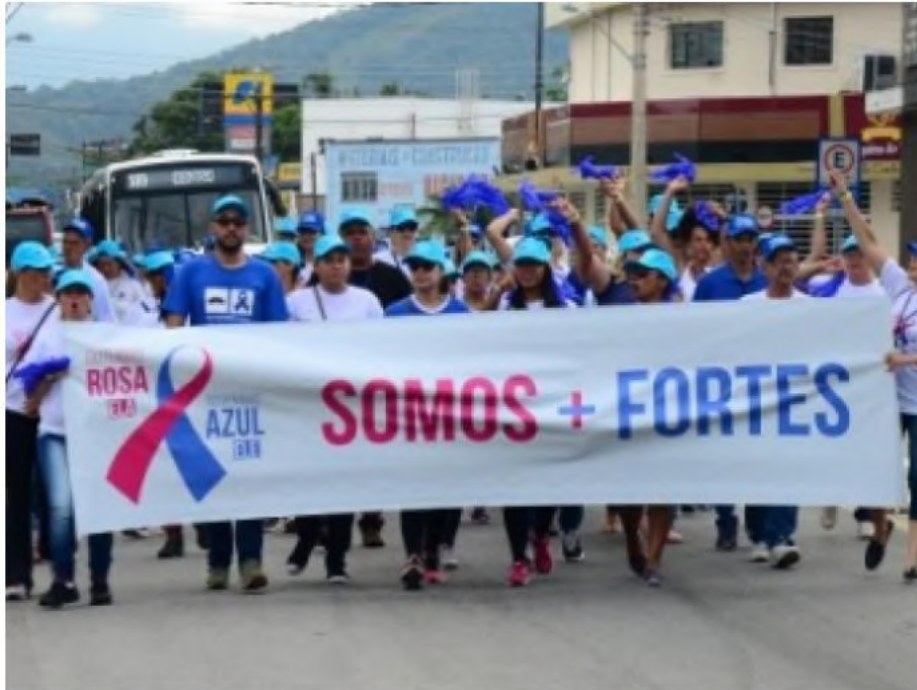
O Novembro Azul também levará palestras e ações em outros pontos da cidade

Novembro Azul é um movimento mundial que acontece durante o mês de novembro para reforçar a importância da prevenção e do diagnóstico precoce do câncer de próstata . A doença é o segundo tipo de câncer mais comum entre os homens brasileiros .