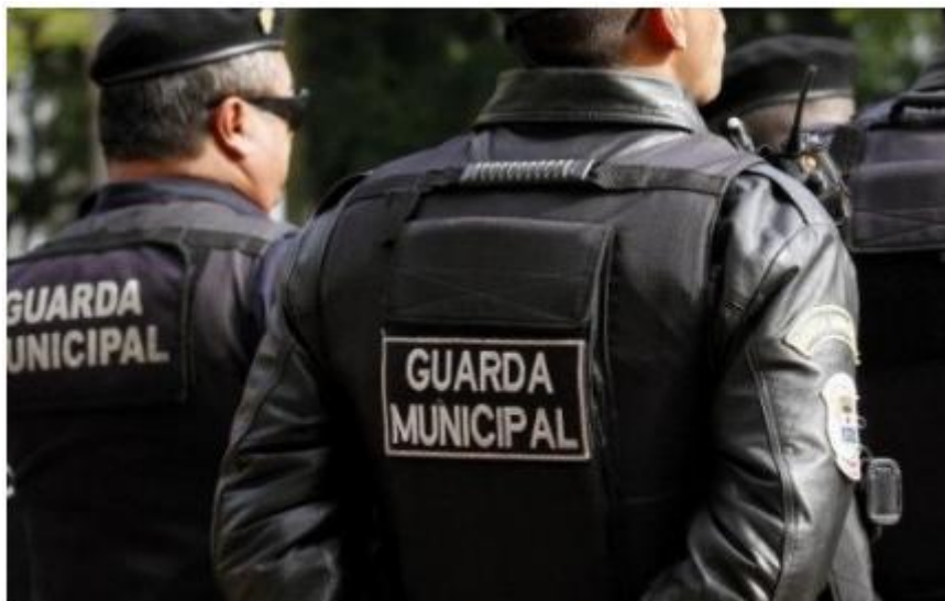
Guarda Municipal de Caraguatatuba-SP foi criada este ano, o que abriu caminho para concurso

O município de Caraguatatuba, a 178 km de São Paulo Capital, contrata pelo regime estatutário. Isto é, que garante a estabilidade empregatícia ao servidor. Há reserva de vagas para pessoas com deficiência.