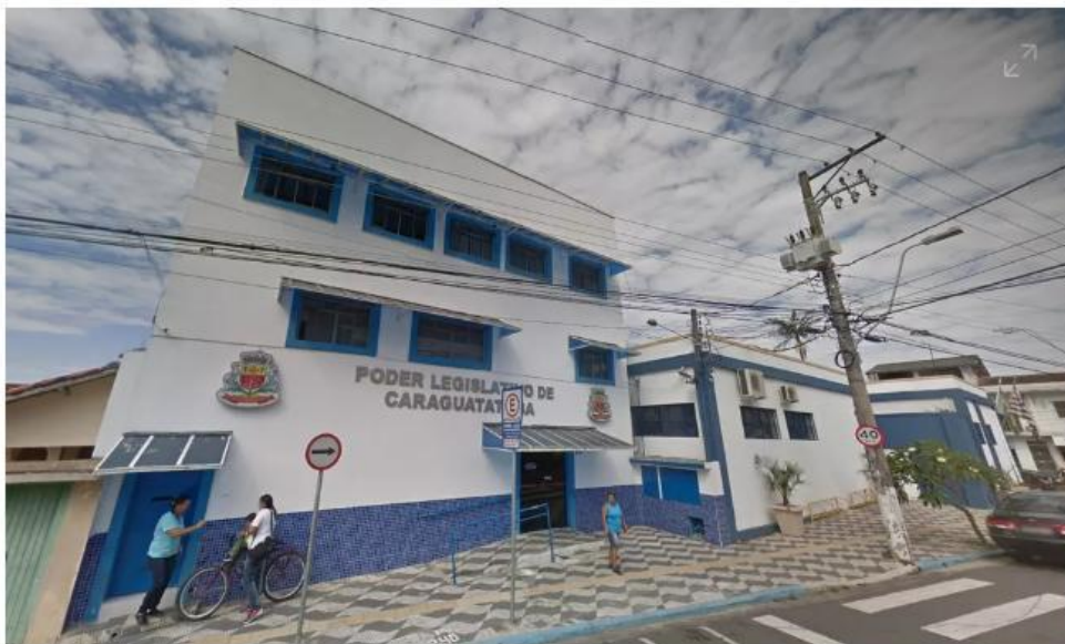
Justiça determina anulação de sessão da Câmara que aprovou empréstimo milionário em Caraguá

Na decisão, juíza considerou que vereadores votaram conscientes de que Justiça havia determinado que o legislativo retirasse da pauta, pela 3ª vez, a votação devido a problemas nos pareceres. Apontamentos foram resolvidos em tempo incompatível, segundo sentença.