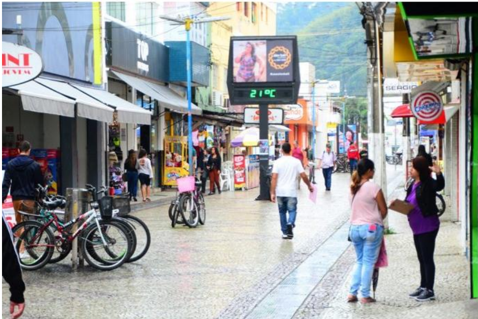
Crescimento principalmente em função dos eventos na baixa temporada

A cidade gerou 873 vagas com carteira assinada no período avaliado