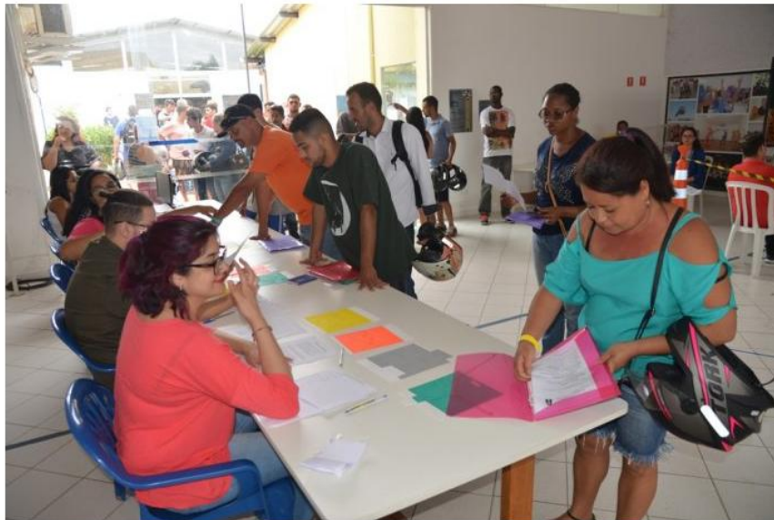
Esta é a segunda ação realizada pelo PAT de Caraguá

Serão oferecidos mais de 300 cargos e candidato pode fazer até três entrevistas