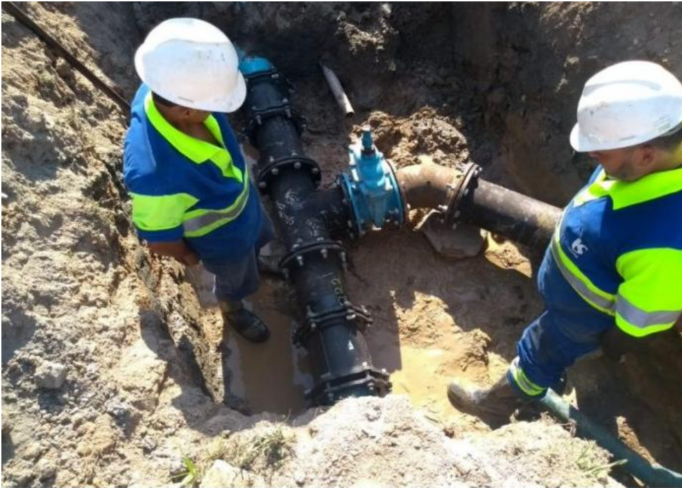
Instalação de equipamento de bombeamento de água no Pegorelli

Objetivo é garantir o abastecimento durante a temporada de verão que se aproxima