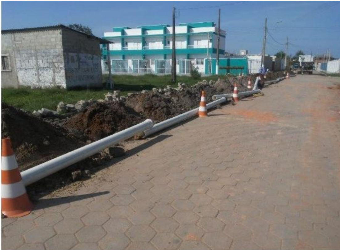
Recomposição do pavimento após término de assentamento de redes no Morro do Algodão

tubulações para reforçar o abastecimento nos bairros Olaria, Morro do Querosene e Casa Branca, beneficiando diretamente 1.962 famílias.