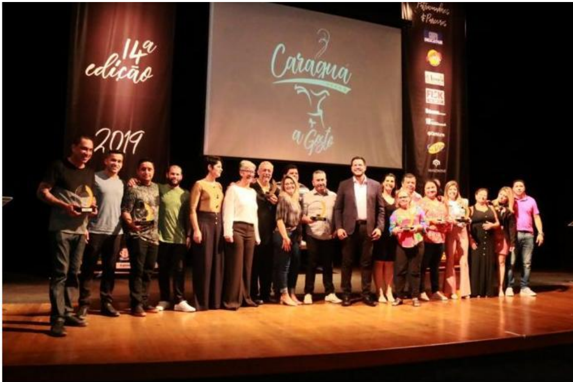
Vencedores da todas as categorias

Secretaria de Turismo estima geração em torno de R$ 1 milhão em negócios