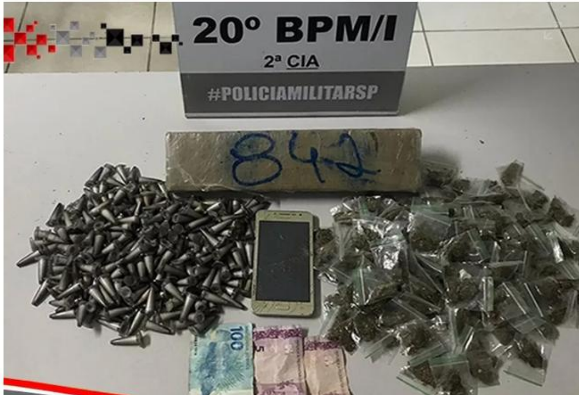
Homem é preso com mochila de drogas em Caraguá.

Suspeito tentou fugir e jogou a mochila que foi resgatada na abordagem.