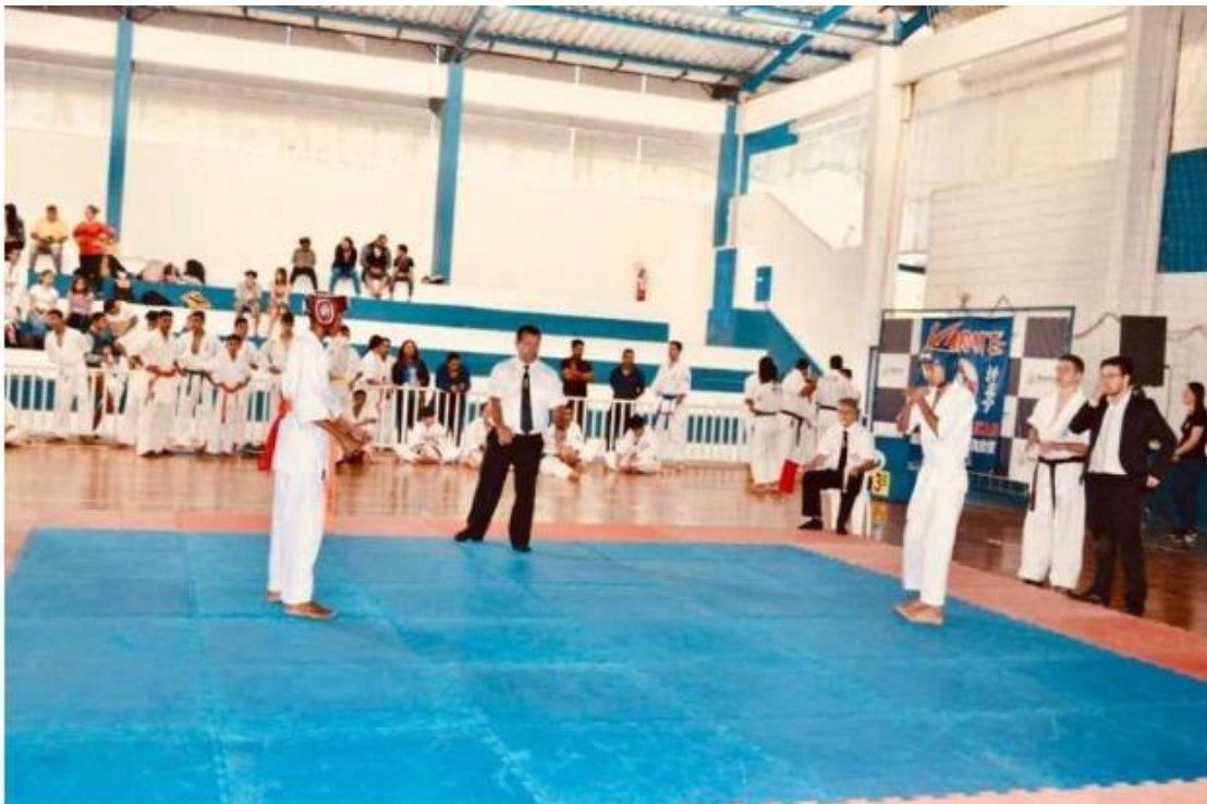
Festival Secer de Artes Marciais edição 2018

Evento contará com a participação de mais de 30 professores, além de atletas iniciantes e graduados