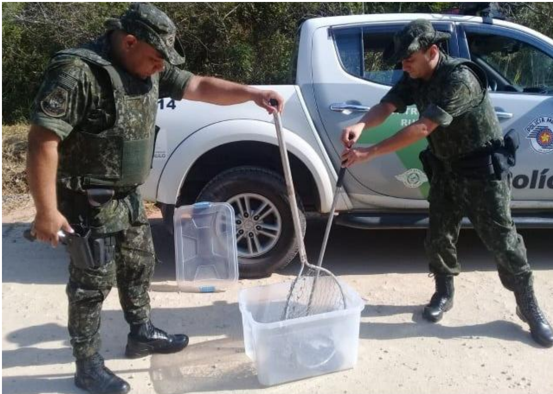
As cobras foram retiradas pela equipe da Polícia Ambiental

Polícia Ambiental resgatou os animais e os devolveu a natureza