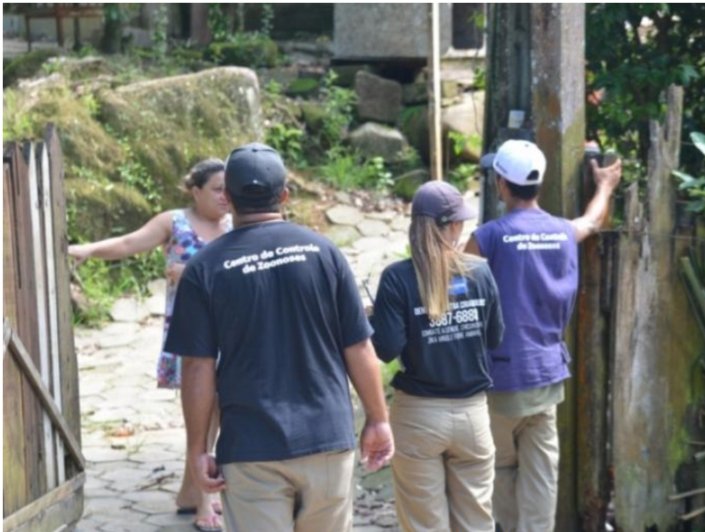
Agentes orientaram a população a detectar possíveis criadouros e eliminá-los com larvicida

A Prefeitura de Caraguatatuba está atenta à prevenção e combate ao mosquito da dengue e está fazendo várias ações nos bairros da cidade.