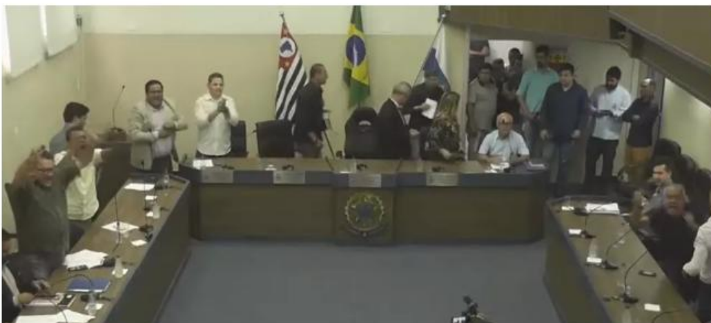
Câmara de Caraguatatuba suspende pela 2ª vez votação de empréstimo milionário; vereadores comemoram e presidência deixa mesa após anúncio de encerramento da sessão

Após primeira suspensão da Justiça, na última terça (10), presidente convocou sessão extraordinária para votar o projeto nesta sexta (13). Encontro durou três minutos e foi suspenso por recomendação do MP. Simultaneamente, juiz expediu nova liminar.