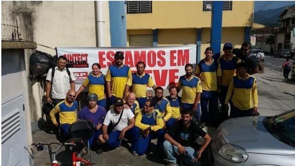
Em Caraguatatuba, a agência permanece fechada

Em Caraguá e São Sebastião os trabalhadores pedem mais segurança, contratação de pessoas e manutenção de veículos e equipamentos