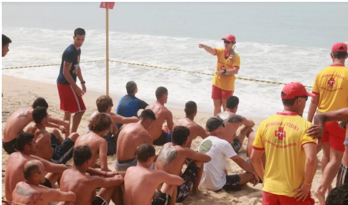
Candidatos participam de seletiva em Caraguatuba

Maioria dos 115 inscritos não conseguiu passar no teste aplicado no dia 9