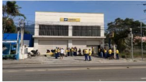
Em São Sebastião o trabalho também parou

Brasil, a categoria pede reposição da inflação do período e é contra a privatização da estatal, que foi incluída no plano de privatizações do governo federal. A categoria pede ainda que seja reconsiderada a retirada de pais e mães do plano de saúde, além de maior segurança no trabalho, melhores condições de trabalho e manutenção de benefícios, informa a Federação Interestadual dos Sindicatos dos Trabalhadores e Trabalhadoras dos Correios (Findect) e a Federação Nacional dos Trabalhadores em Empresas de Correios e Telégrafos e Similares (Fentect).