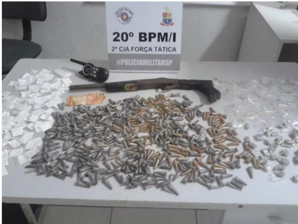
Trio é preso por tráfico de drogas em Caraguá

Os policiais estavam em patrulhamento pelo bairro quando viram quatro homens contando e dividindo drogas em uma escadaria. Durante a abordagem, um deles conseguiu fugir.