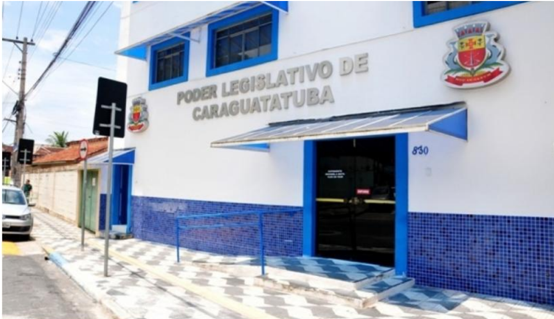
Câmara de Caraguatuba