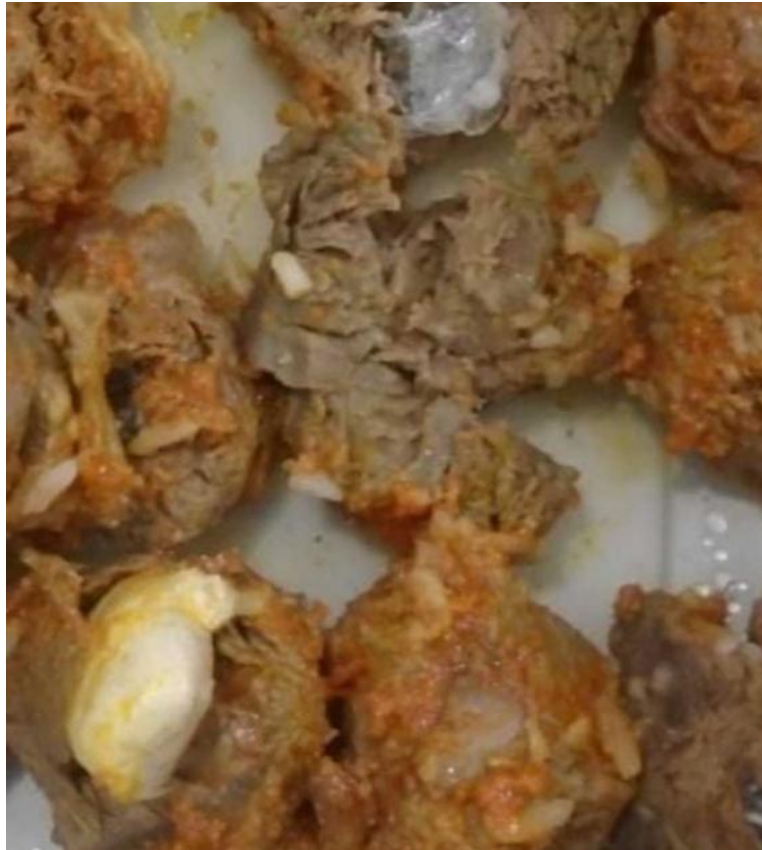
Drogas foram encontrados em meio a comida