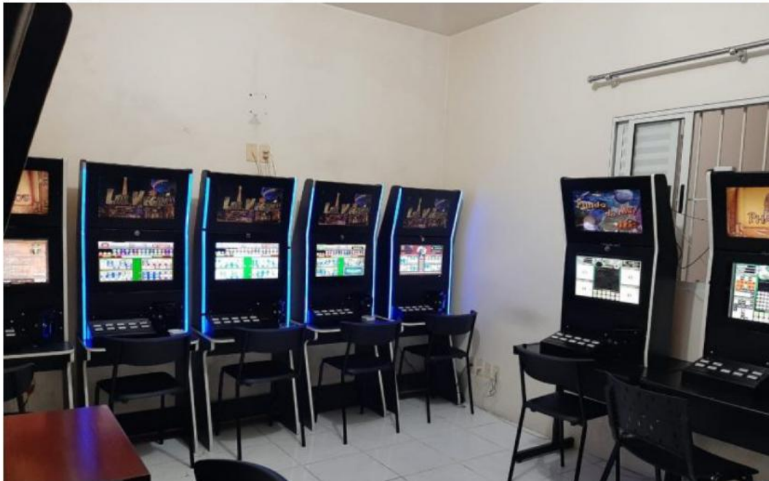
Casa de Jogos em Caraguá