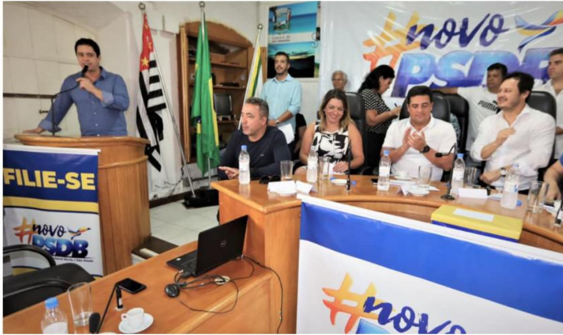
Eleição do PSDB no Litoral Norte.