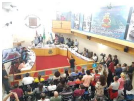
Artistas e comunidade LGBTI+ lotaram o plenário durante a votação do plano de cultura