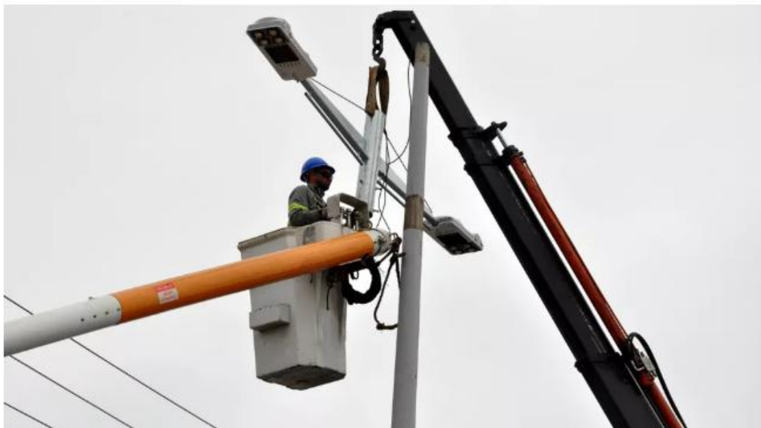
Prefeitura de Caraguatatuba

Pensando nisso, o novo passo desse processo de modernização será levar benfeitorias também nos núcleos que já passaram pela regularização fundiária.