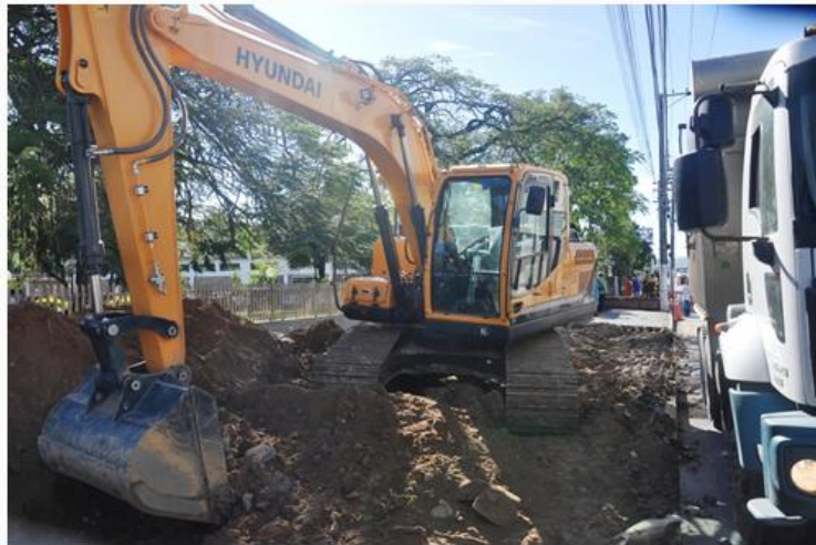
As obras visam dar mais fluidez e ordem ao trânsito e tornar mais segura a parada dos ônibus nos pontos.

A Prefeitura de Caraguatatuba iniciou nesta segunda-feira (22) as obras de construção de uma baia de acesso a ônibus e melhorias na entrada da Casa de Saúde Stella Maris, região central da cidade.