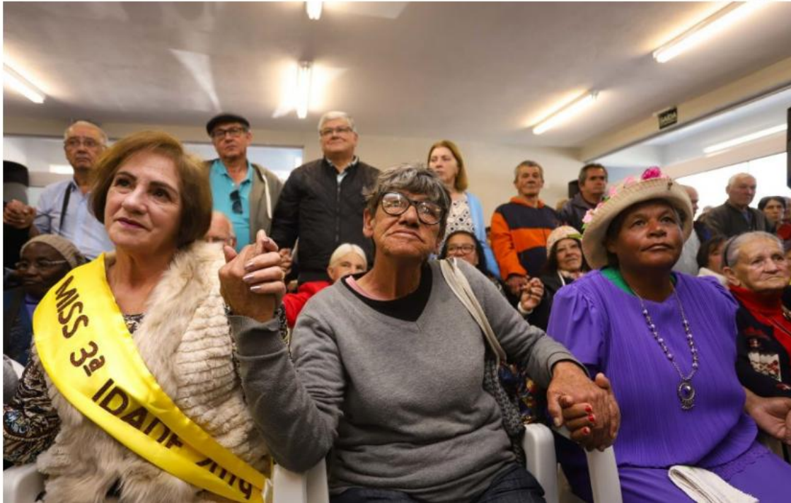
Centro de Convivência do Idoso (CCI) "Wilma JundiDubieux", em Campos do Jordão