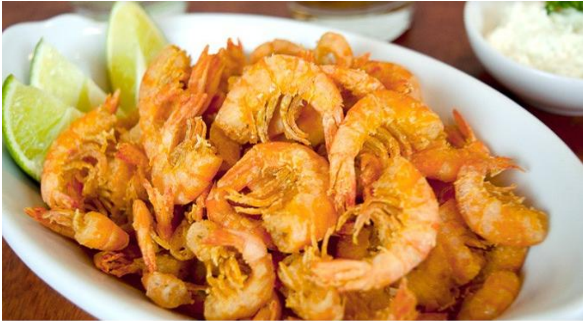
O 22º Festival do Camarão segue até 21 de julho, no Centro

A 22ª edição do Festival do Camarão de Caraguatuba recebe os visitantes a partir das 10h desta sexta-feira (12). A expectativa dos organizadores é que mais de 100 mil pessoas passem pelo recinto montado da Praça da Cultura (Avenida da Praia) nos 10 dias da festa. Além da vasta programação cultural e musical com 47 atrações, a festa conta com 25 barracas, das quais 23 vão vender receitas diversas à base de camarão e outras duas, doces. Os preços variam de R$ 5 a R$ 45.