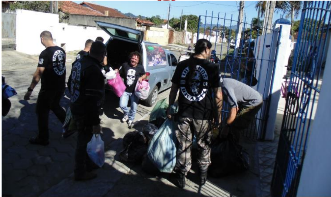
O veículo ficou lotado de sacolas de roupas que foram doadas para instituição

A ação teve o objetivo de arrecadar roupas e agasalhos, que foram entregues no domingo dia (30/06), para a Instituição Centro de Recuperação humana Renascer-Caca do Caminho pelo moto clube, que fica no bairro Porto Novo.