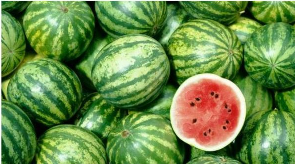
Projeto produz cerca de 1,5 mil unidades de alimentos por mês

A produção da Horta Ecológica tem alface, acelga, couve, repolho, cebolinha, salsa, abóbora e até melancia