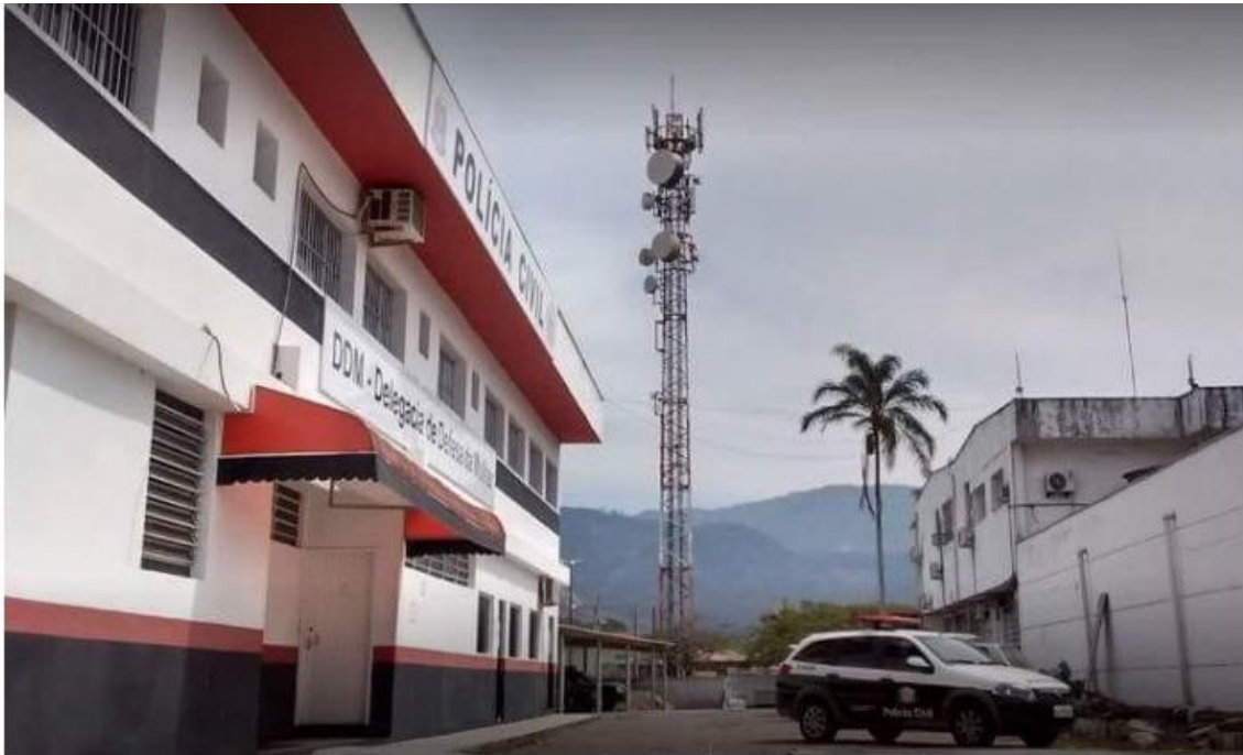
O flagrante aconteceu na última terça-feira, no Indaiá

Linha de investigação indica que uma travesti faria cafetinagem com crianças