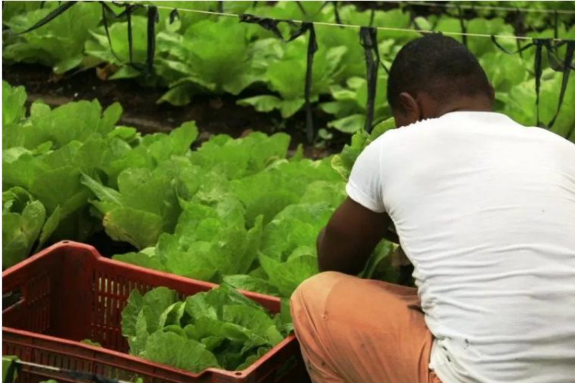
Detento cuida das hortaliças destinadas às famílias carentes da cidade

Foram colhidas onze caixas de alface crespa e acelga, que além de servirem ao Banco de Alimentos, ainda rendeu a alimentação para uma refeição de 1400 detentos do CDP.