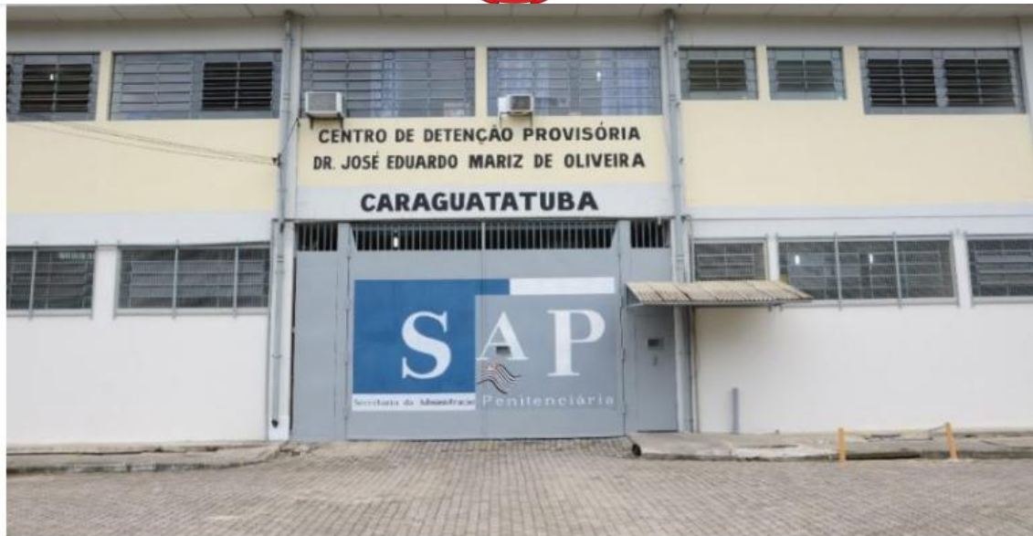
CDP de Caraguatatuba.