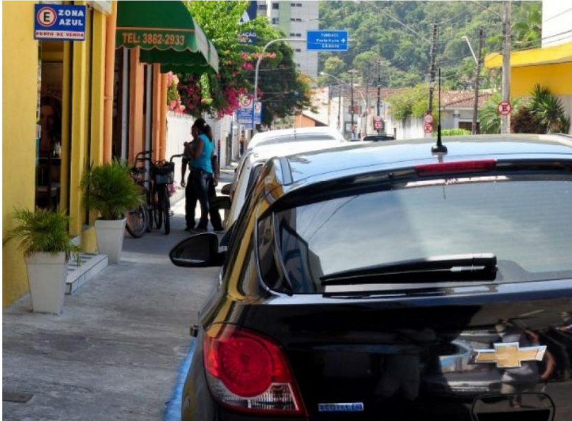
Zona Azul é suspensa em Caraguá