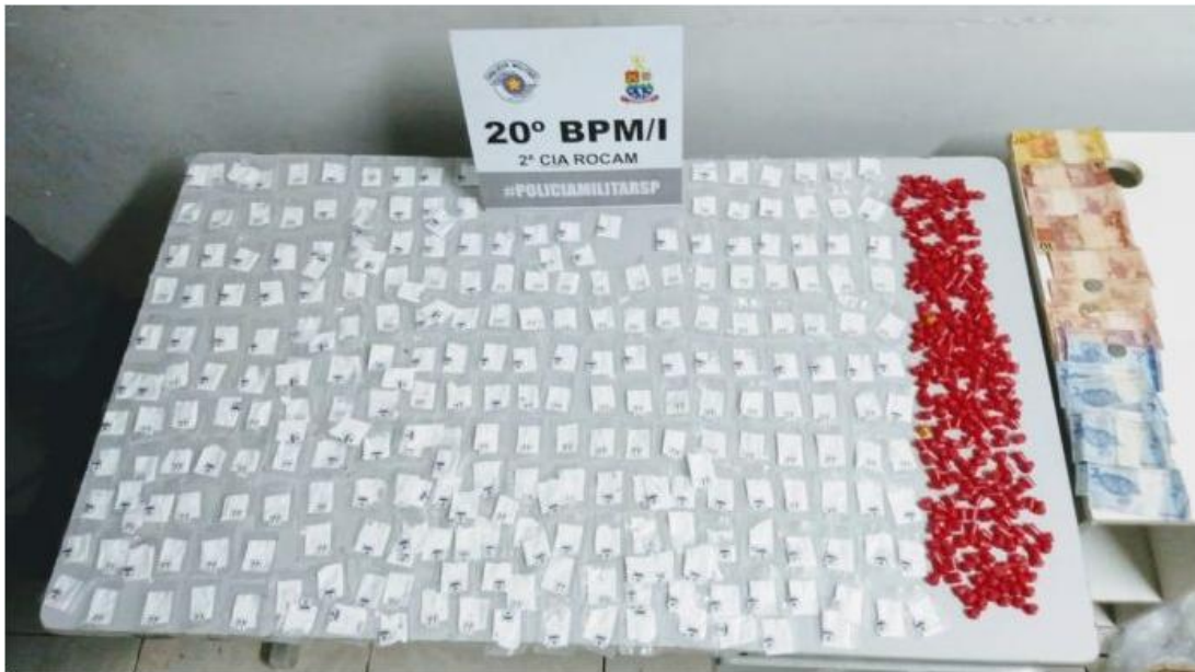
O flagrante aconteceu na madrugada desta quarta-feira

A Polícia Militar prendeu dois homens acusados de vender drogas na escadaria da Rua Antônio Mathias dos Reis Filho, no bairro Benfica, região central de Caraguatatuba, na madrugada desta quarta-feira (3/7). O local é conhecido por várias denúncias de tráfico. Identificado como W.M.F.S., o suspeito já havia respondido por tráfico e o outro, R.P.R., já tinha passagem anterior por porte de drogas.