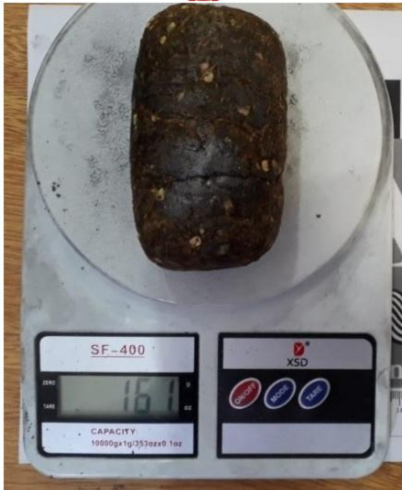
Maconha que estava escondida na vagina de uma das mulheres detidas no CDP de Caraguá

As três mulheres tiveram seus nomes suspensos do rol de visitas da SAP. As direções das unidades prisionais enviaram comunicados para a Vara de Execuções Criminais, além de instaurarem Procedimento Disciplinar Apuratório.