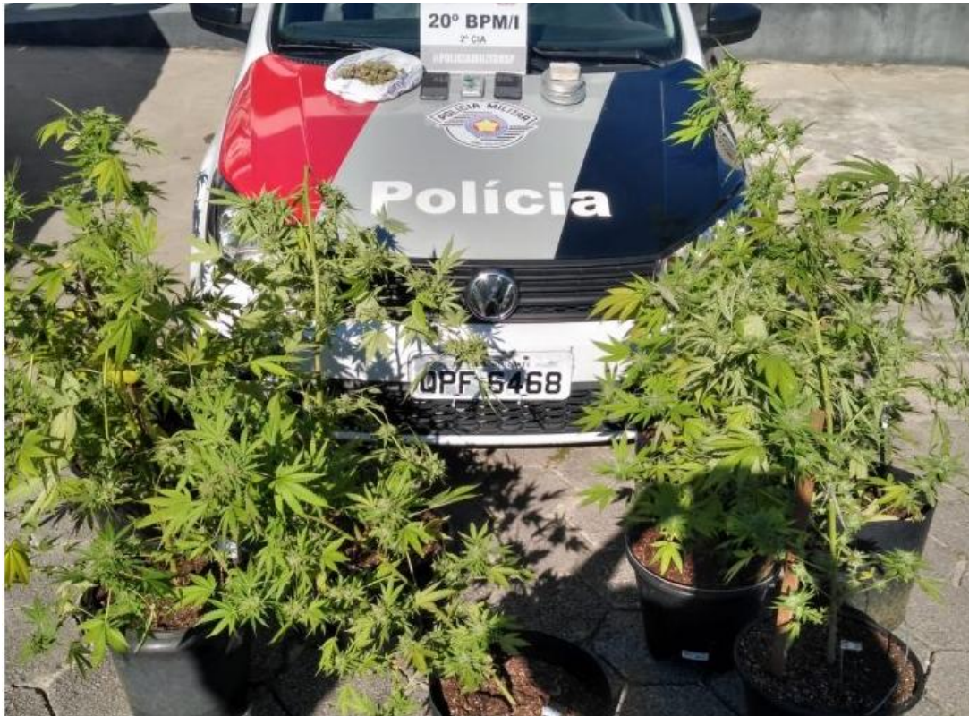
A plantação foi localizada neste domingo, no Porto Novo

Foram localizados 10 vasos com a planta dentro de uma residência