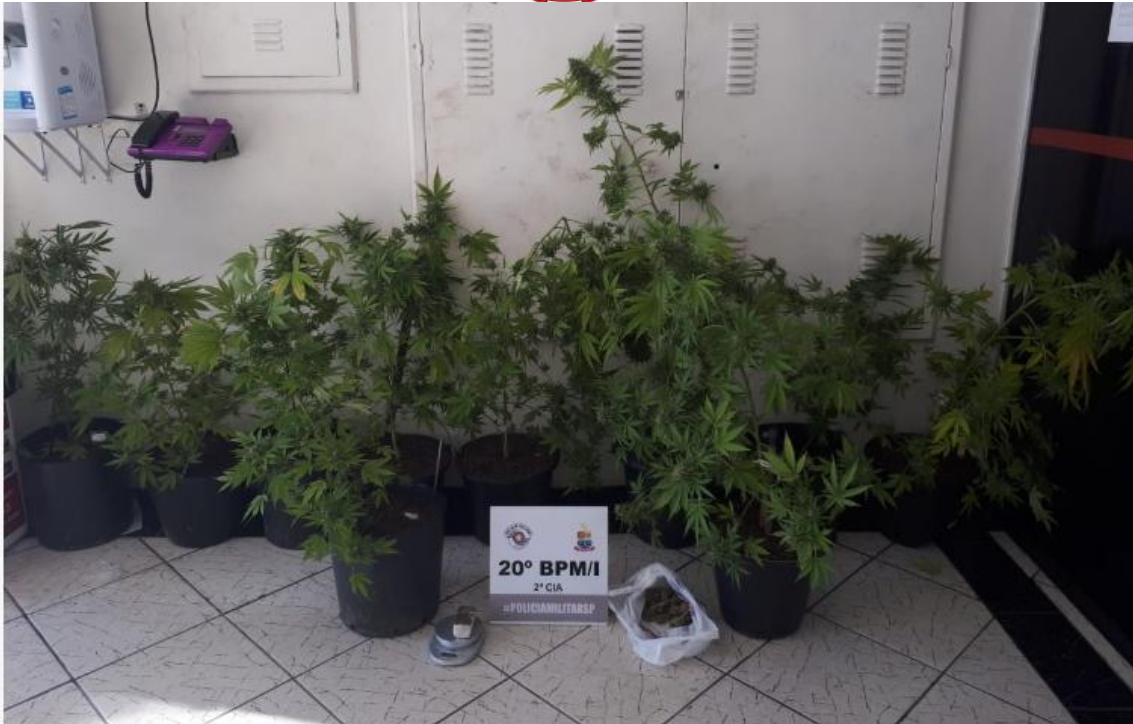
Fotos: Polícia Militar: Vasos de maconha que foram apreendidos no bairro Porto Novo