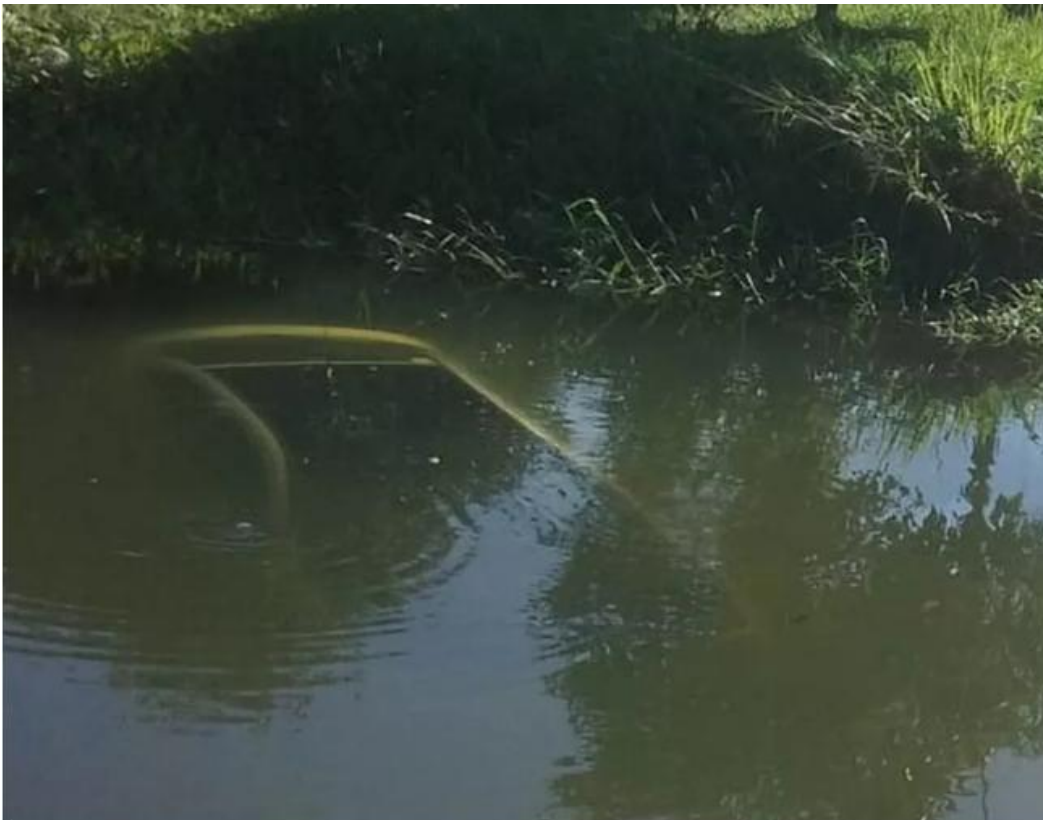
Carro caiu em rio durante perseguição em Caraguatatuba

Segundo polícia, motorista levava drogas no veículo e tentou fugir após ser flagrado por uma blitz. Ele foi retirado da água e preso em flagrante.