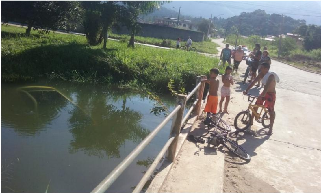
Carro ficou submerso no rio em Caraguá.