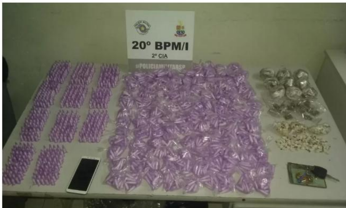
Droga que estava no carro que afundou foi apreendida em Caraguatatuba

O suspeito, que era procurado por roubo, foi preso em flagrante e encaminhado à delegacia.