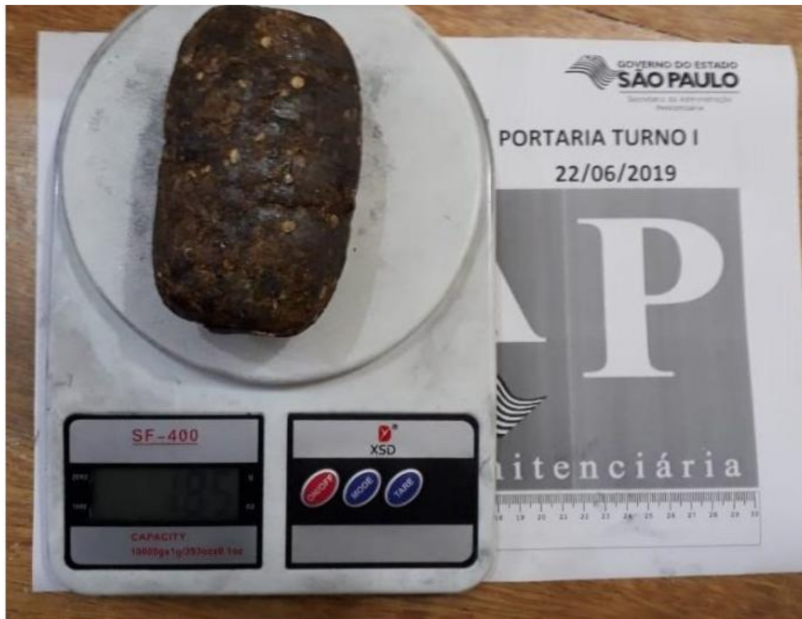
Maconha e papéis de seda estavam no corpo da visitante

Companheira e irmã de detentos foram pegas com maconha e seda