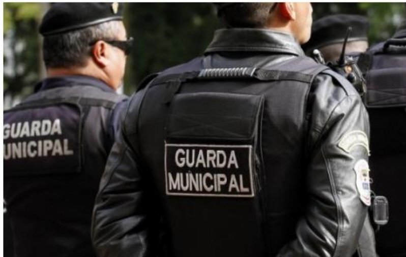
Objetivo da proposta é aumentar a segurança na cidade

Vereadores aprovaram ainda o orçamento de R$ 805,6 milhões para 2020