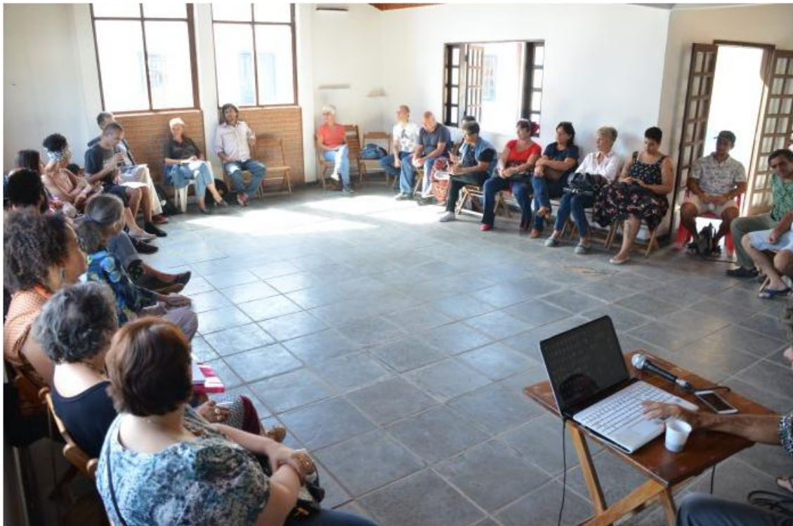
Encontro é aberto ao público e gratuito

O encontro será das 8h às 18h no Teatro Mario Covas