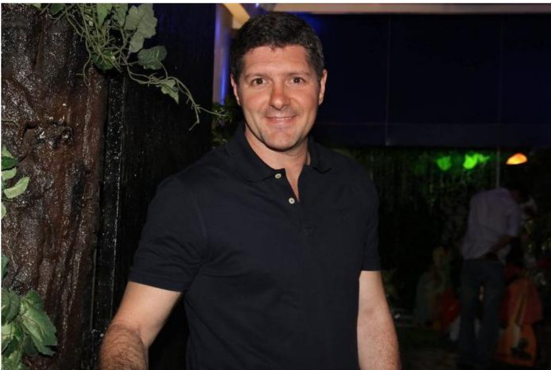
Ator vai interpretar a personagem Heródes

Mais de 30 mil pessoas devem acompanhar a encenação dos últimos dias de Jesus Cristo na Terra