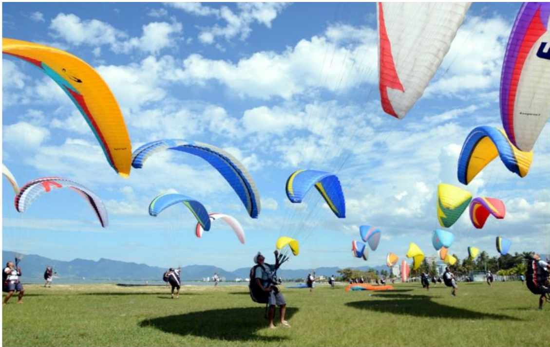
Promovido dentro das comemorações dos 162 anos de Caraguatatuba, o encontro conta com as categorias asa delta e parapente.

Mais de 80 pilotos de diversas regiões do país são esperados para o Festival de Voo Livre de Caraguatatuba, no próximo fim de semana (20 e 21). Os saltos serão realizados na pista de voo livre, no Morro Santo Antônio, com pouso na Praia do Centro