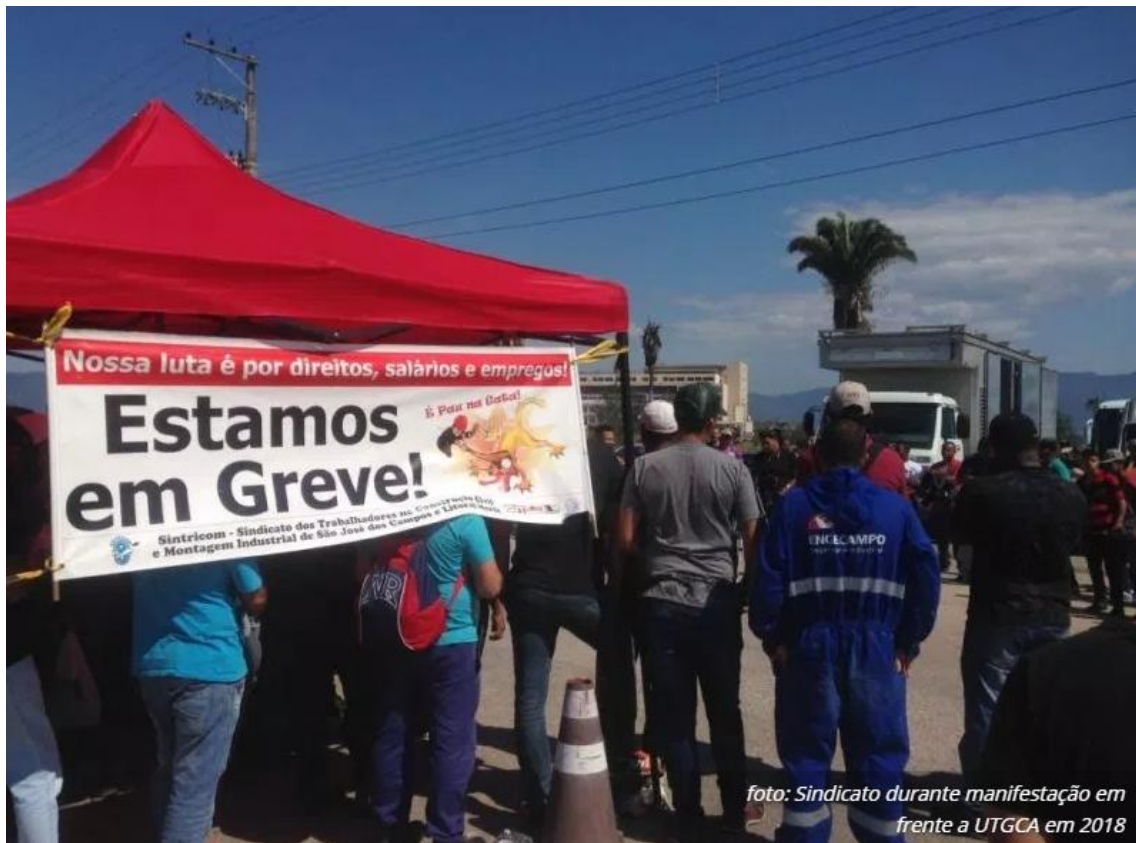
foto: Sindicato durante manifestação em frente a UTGCA em 2018

Representantes do Sindicato dos Trabalhadores nas Indústrias da Construção Civil, Mobiliário e Montagem Industrial de São José dos Campos e Litoral Norte(Sintricom) realizaram, na manhã desta terça(16), uma assembleia na entrada da Unidade de Tratamento de Gás de Caraguatatuba(UTGCA) da Petrobras. O sindicato reivindica reajuste salarial. Os funcionários não foram impedidos de entrar na empresa. A assembléia foi pacífica. Segundo informações, até o momento, não houve acordo entre o Sindicato e o Empregador. Não conseguimos falar com representantes do sindicato em sua sede em São José dos Campos. Os representantes se encontravam em uma reunião e não poderiam atender a imprensa.