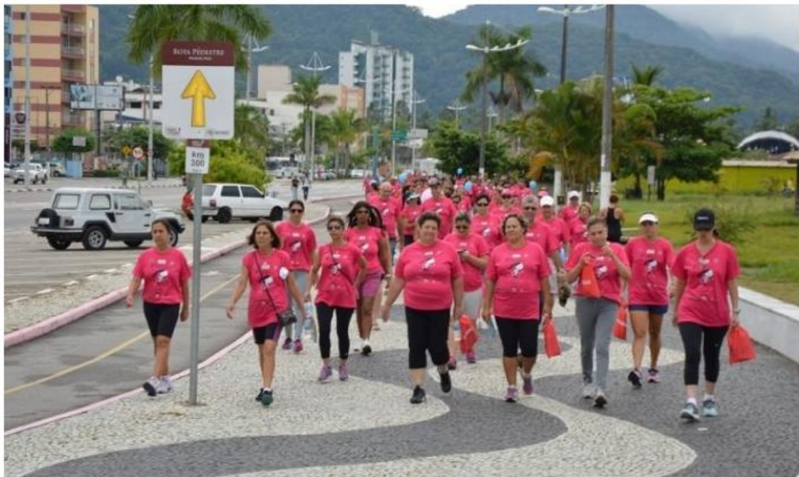
A 6ª edição da caminhada é promovida pela ACE

Ação também vai arrecadar fraldas infantis para doação, nesta sexta-feira (8)