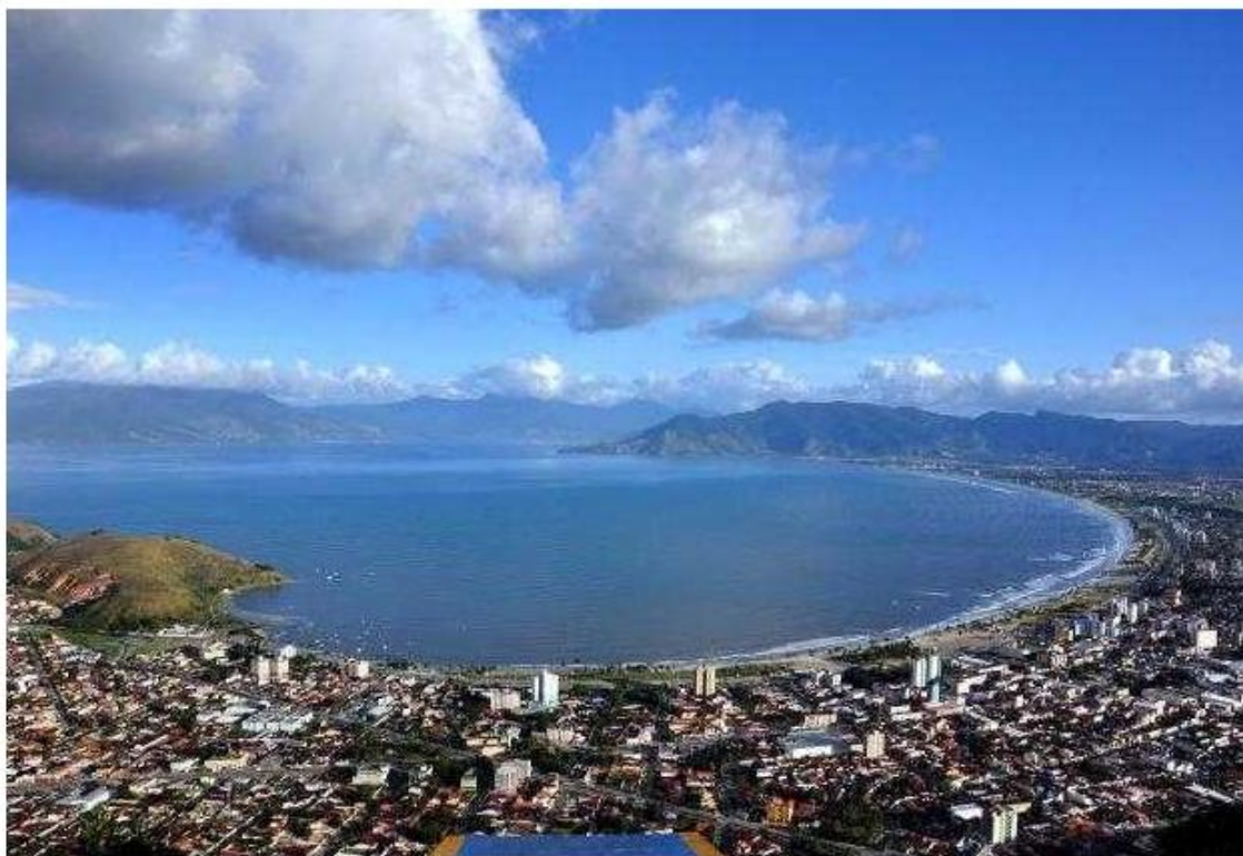
Morro de Santo Antônio com a vista de Caraguatatuba, São Sebastião e Ilhabela

Ao todo, 14 municípios da região serão contemplados com o montante do governo estadual