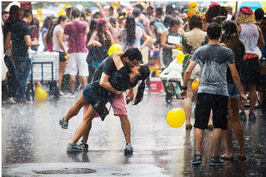
A festa de Carnaval deve acontecer embaixo de chuva no LN

Previsão é que a frente fria que passa pela região permaneça durante o feriado trazendo mais chuva