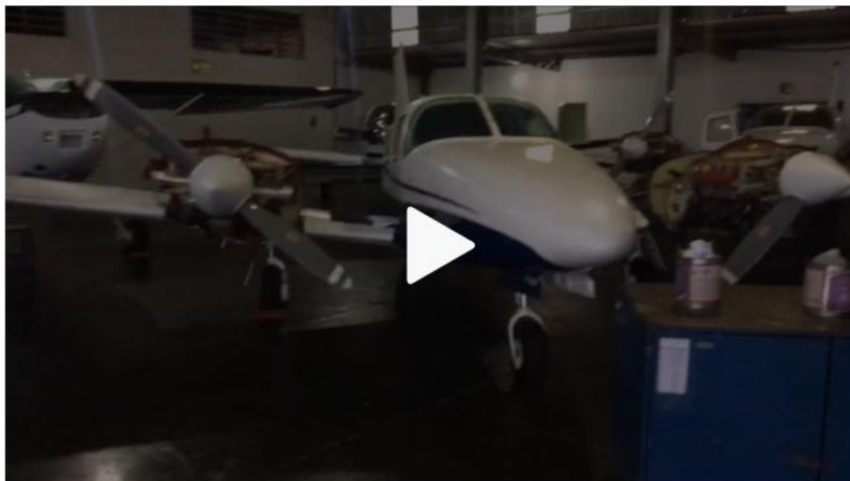
Polícia Federal prende um em operação contra o tráfico internacional em Caraguá

21/02/2019 19h47 · Atualizado há 11 horas