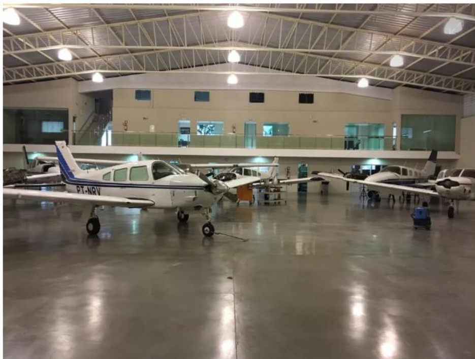
PF realiza operação contra o tráfico internacional de drogas