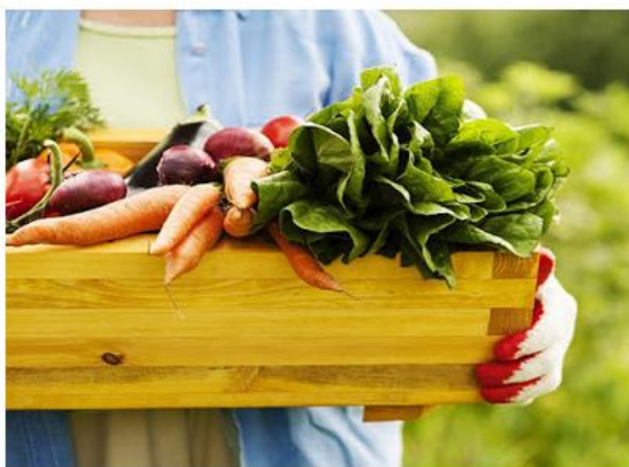
Produtores têm até 7 de fevereiro para se cadastrar

Objetivo é estimular economia local e oferecer produtos frescos, como verduras, hortaliças e frutas