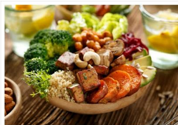
O evento acontece no próximo fim de semana no Centro

Evento traz culinária vegana (doces esalgados), vestuário, cosméticos, acessórios e artigos da cultura pop/Geek