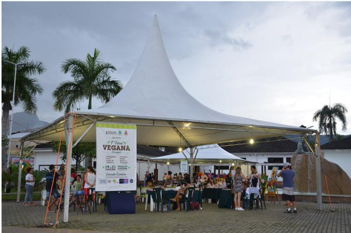
Praça do Caiçara, em Caraguatatuba, recebe entre os dias 18 e 20 de janeiro a 2ª edição da Feira Vegana. (Foto: JC Curtis/Fundacc)

Por: Da Redação, com prefeitura de Caraguatatuba