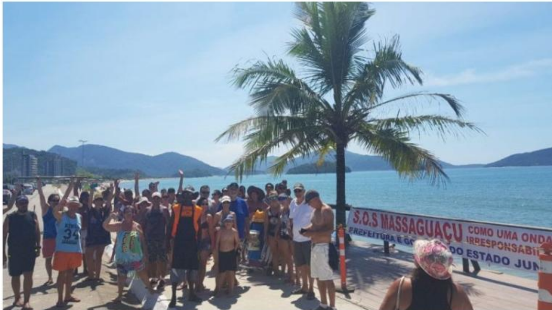
Moradores e veranistas protestaram em fevereiro do ano passado

No ano passado, em fevereiro, moradores e veranistas fizeram um protesto no local, solicitando urgência nas reformas. Quase um ano se passou e até agora, nenhuma providência foi tomada pela prefeitura.