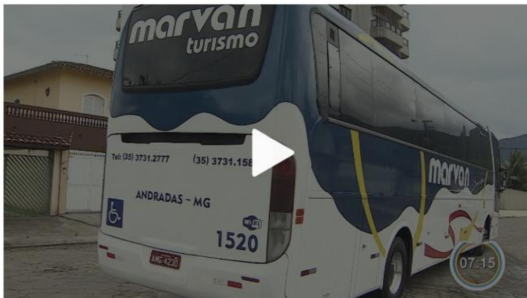
Caraguatatuba inicia cobrança de taxa para entrada de turista de excursões

17/12/2018 09h58 · Atualizado há 21 horas