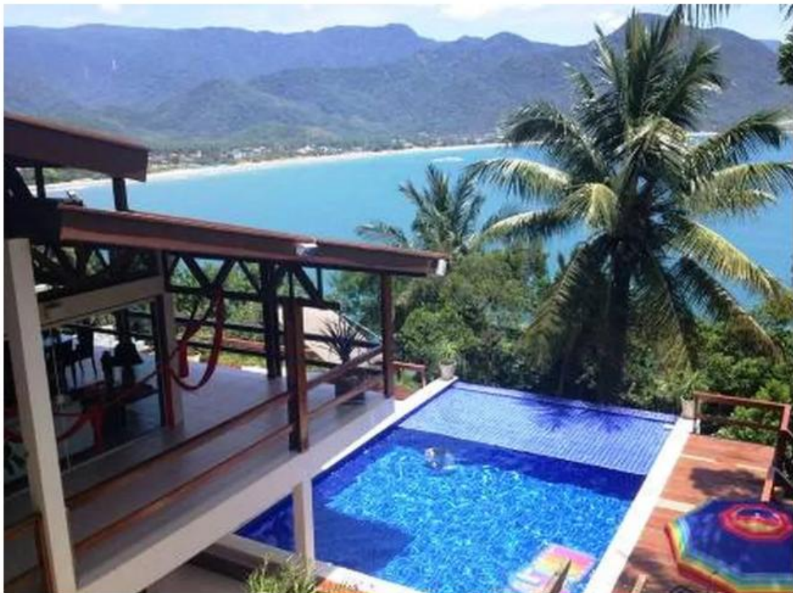
casa praia aluguel temporada

11/12/2018 07h24 · Atualizado há 20 horas