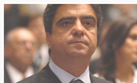
Tribunal de Contas indica precatórios ilegais em 2013

A maioria dos vereadores de Caraguatatuba acatou parecer do Tribunal de Contas referente a 2013