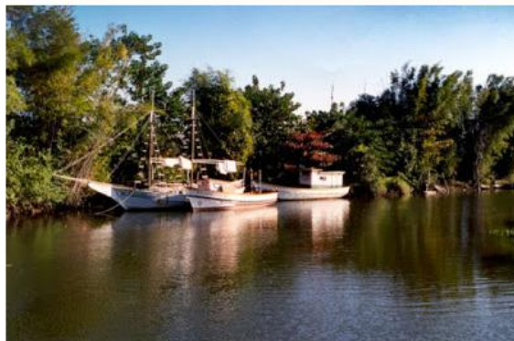
Comunidade ressaltou importância da educação ambiental

O local é Unidade de Proteção Integral e o Plano visa cumprir a preservação, turismo de base ecológica e a realização de pesquisas científicas