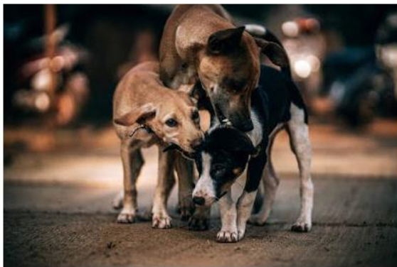
Estão à disposição 15 gatos e 20 cachorros

Os animais não têm raça definida, são castrados, vermifugados e microchipados