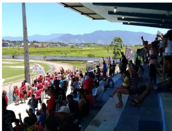
Tiro foi dado fora do campo

O crime aconteceu no Cemug e vítima segue internada