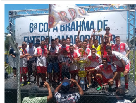
Premiações realizadas após tumulto

Junto com os representantes de equipes e atletas que encontravam-se em campo, decidiu-se que não haveria a necessidade de finalizar a partida final da segunda divisão, pois o placar já estava definido. Ainda assim, sem festejos, foram entregues os troféus e medalhas às equipes.