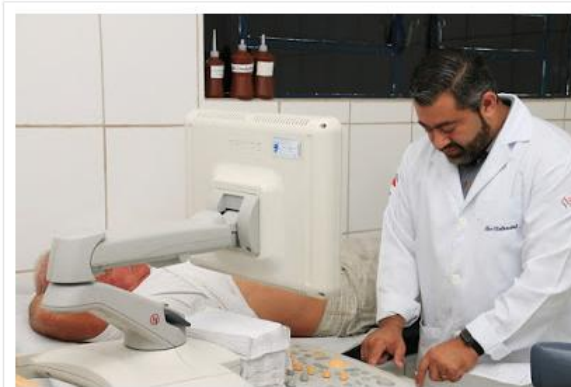
Foram quase 4 mil exames de maio a novembro

Mutirões da Saúde tiveram investimento de R$ 562 mil