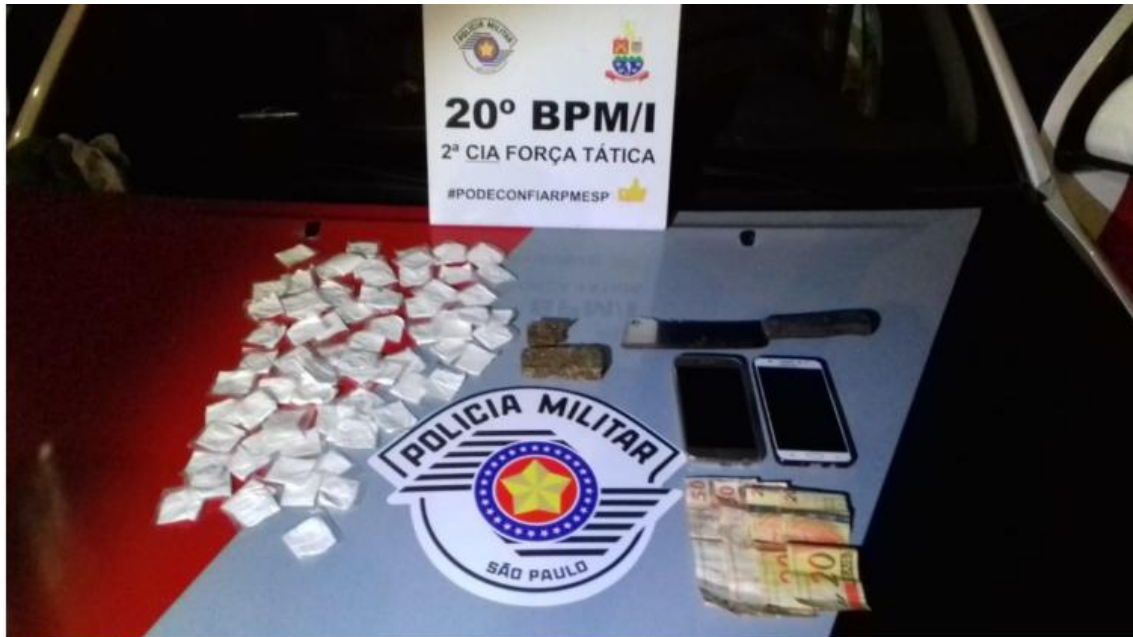
Drogas apreendidas foram apresentadas no DP.

Na noite de quinta-feira, dia 6, equipe de Força Tática da Polícia Militar de Caraguatatuba, após receber informação anônima de que o homem, procurado pela prática de homicídio, estaria em uma residência no Jardim Gaivotas.