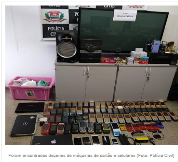
Foram encontradas dezenas de máquinas de cartão e celulares

Foram apreendidos nove veículos de luxo em sua residência, além de moto e jet-ski