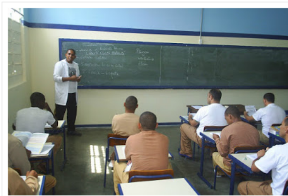
Hoje mais de 33 mil presos receb aulas no Estado de SP

O exame tem o mesmo conteúdo feito para as pessoas que estão em liberdade