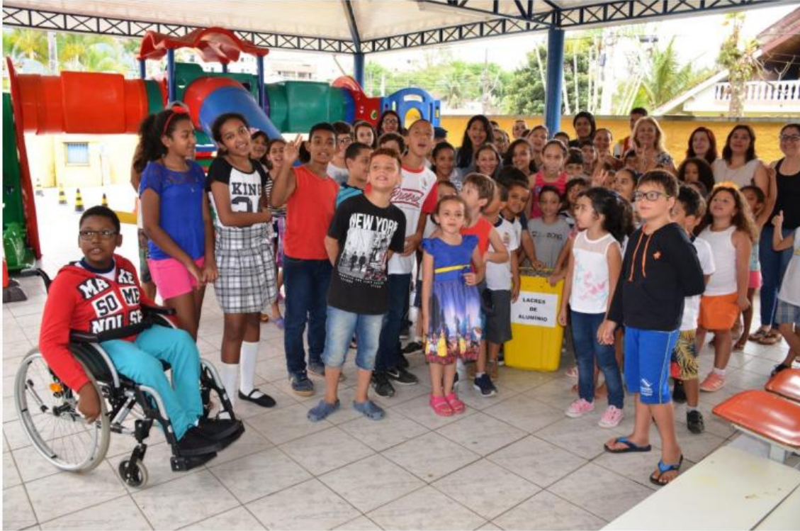
Crianças e adultos posam com caixa de papelão onde estão os lacres arrecadados.

Por: Da Redação, com prefeitura de Caraguatuba