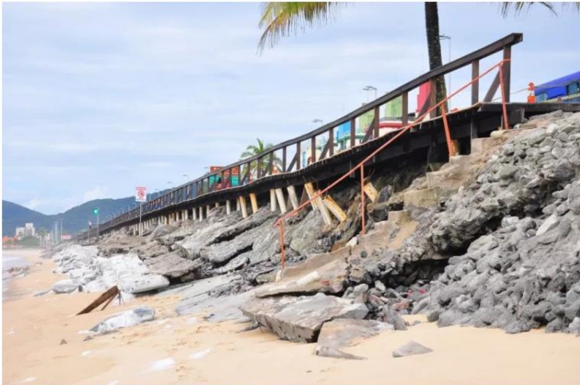
Avanço da maré no Massaguaçu, já destruiu parte da rodovia, quiosques e, recentemente, um deck de madeira construído pela prefeitura, que encontra-se interditado

Em declarações concedidas à imprensa, a pesquisadora tem garantido que “Não existe nenhuma praia fora de risco no Estado de São Paulo, porque o nível do mar está subindo e, quando isso acontece (redução da faixa de areia), esse é um dos primeiros impactos”.