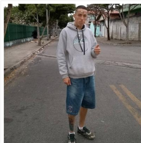
Jovem passava o aniversário na praia

Ele comemorava o aniversário na praia quando houve o acidente