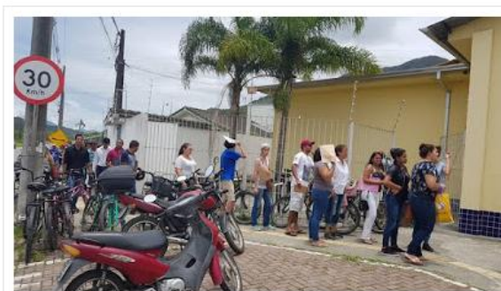
PAT disponibilizou pelo menos 350 vagas

Posto de Atendimento ao Trabalhador faz mutirão para atender demanda de emprego na temporada de verão