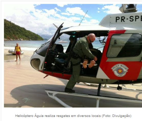
Helicóptero Águia realiza resgates em diversos locais