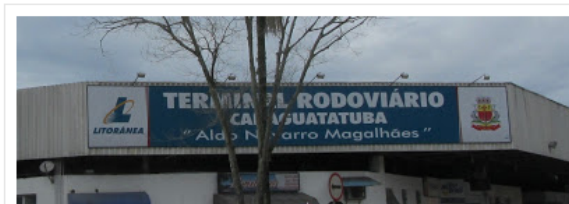
Prefeito promete sinal gratuito na Rodoviária Municipal

Prefeito informou que o sinal estará disponível ainda esta semana na rodoviária, UPA e CEM/CEO