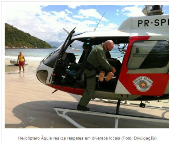
Helicóptero Águia realiza resgates em diversos locais

São 40 guarda-vidas temporários em Caraguá, 68 em São Sebastião, 85 em Ubatuba e 24 em Ilhabela para reforçar a segurança no Verão