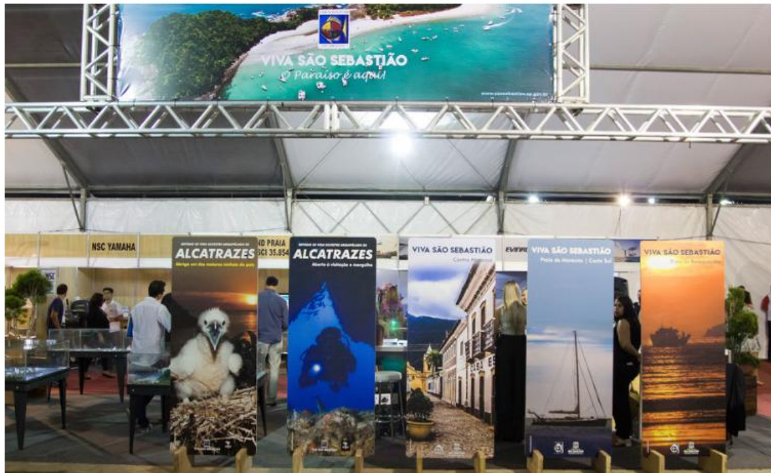
O Boat Show atrai amantes do mundo náutico em São Sebastião

Veículo: Sistema Costa Norte de Comunicação