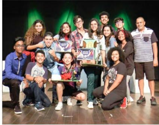
Além do primeiro lugar na categoria de peça teatral, o grupo faturou os prêmios de melhor trabalho de pesquisa, direção e melhor atriz; grupo de Caraguatatuba ficou em segundo lugar no Festival

Ao todo, foram entregues 10 troféus exclusivos feitos pelo artista plástico Robson Nascimento, nas categorias Melhor Ator, Melhor Atriz, Melhor Diretor, Melhor Cenó-