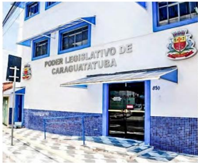
Câmara deve votar dois projetos de lei com benefícios aos servidores públicos municipais

Ambas as propostas encaminhadas pelo prefeito deverão ser votadas em regime de urgência especial na Câmara de Caraguatuba. (GSP)