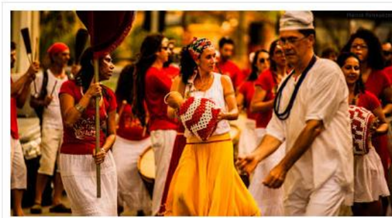
Maracatu Odé da Mata se apresenta na segunda (19)

O evento traz comidas típicas, arte, artesanato afro e apresentações culturais nesta segunda e terça-feira (19 e 20)