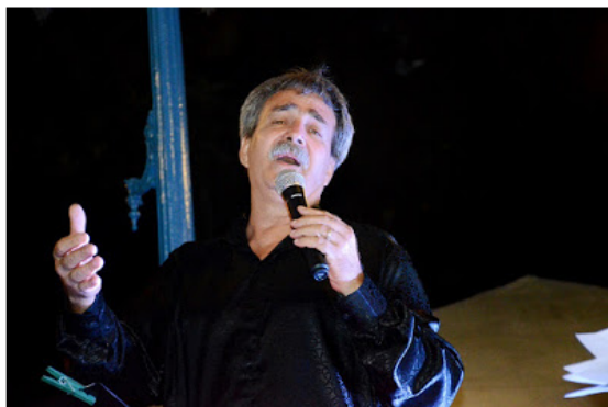
O cantor romântico se apresenta na Praça do Coreto

O feriadão de Proclamação da República fica mais romântico com a apresentação do músico argentino Juan Bruera no 'Prata da Casa' desta sexta-feira (16). O show começa a partir das 20h30 na Praça Dr. Cândido Mota (Coreto), no Centro de Caraguatatuba e é gratuito.