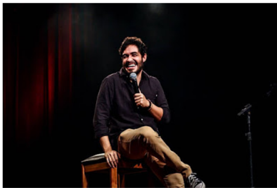
Apresentação acontece no teatro Mario Covas, na sexta

Os vídeos do artista sobre educação somam mais de 10 milhões de visualizações