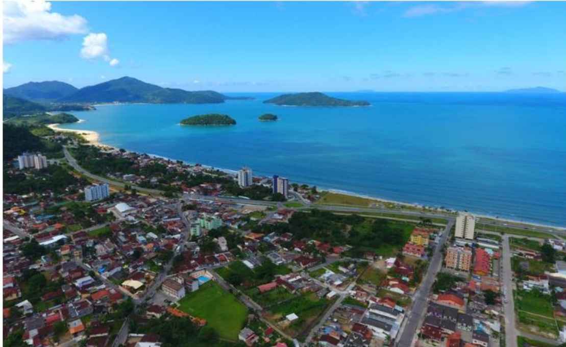
Vista de Caraguatatuba

Veículo: Sistema Costa Norte de Comunicação