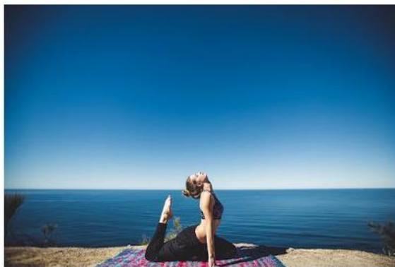
A aula esta agendada para às 19h de domingo (11)

O evento traz ainda palestras, exposições de produtos e atendimentos presenciais