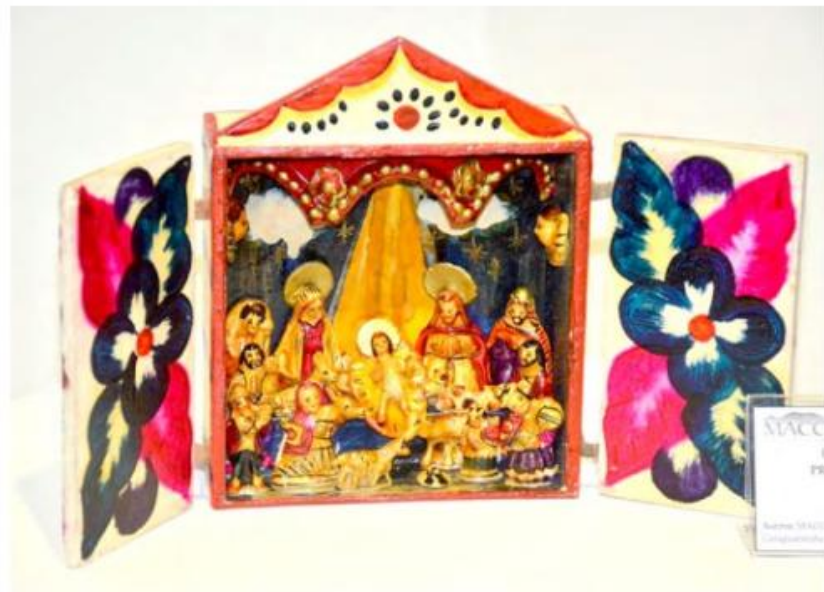
O objetivo do concurso é fomentar e preservar a cultura e a memória das tradições religiosas populares do Natal e incentivar a criatividade das tradições populares

O concurso será composto por seis etapas, sendo inscrição, montagem nos dias 10 e 11 de dezembro, abertura da exposição no dia 12, reunião da Comissão Julgadora para análise e classificação final dos presépios e apuração dos votos do Júri Popular dia 18, divulgação do resultado em 20 de dezembro e entrega da premiação até 23 de dezembro.