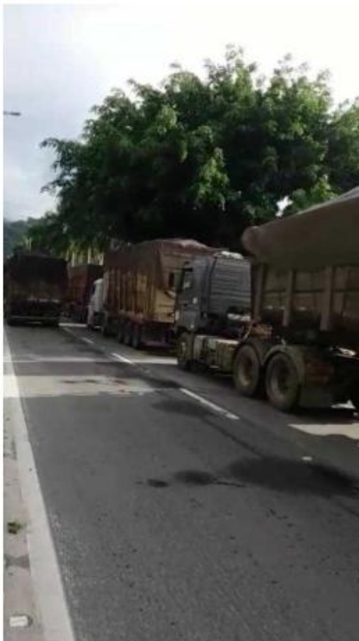
Carretas com lixo de Caraguá