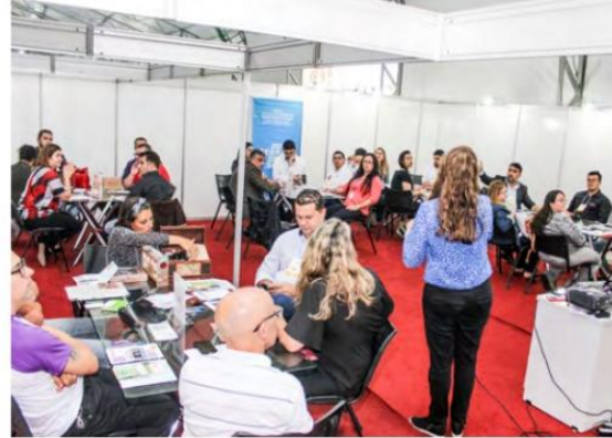
Desde quinta-feira (8) o evento gratuito apresentou palestras e reuniu mais de 100 expositores

A agenda segue com os temas "Legislação Tributária para Empreendedores" e "Oportunidade de Investimentos e Exportações", ambas realizadas, às 17h. O encontro fecha com "Case de Sucesso - Frente a Frente com os Tubarões"