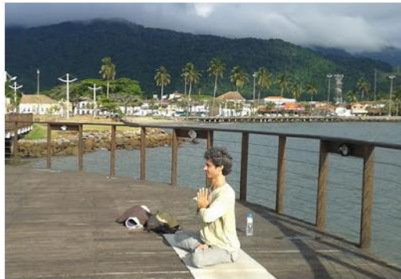
A aula será ministrada pelo instrutor Luciano Draetta