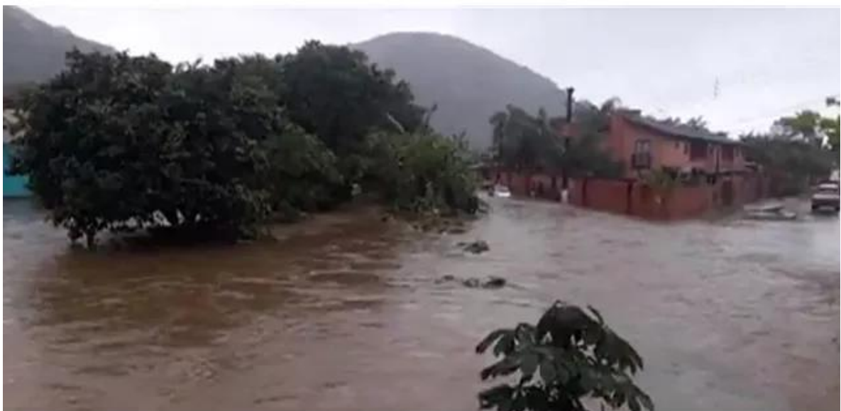
Caraguatatuba Alagamentos Chuvas

A Defesa Civil da cidade prossegue com vistorias em áreas de risco, verificando a necessidade de remoção de famílias. Nesta sexta, a única escola que não haverá aula é a EMEF Professora Maria Thereza de Souza Castro (CIEF do Getuba).