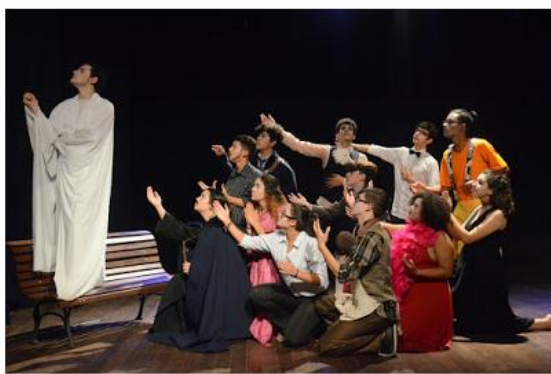
A peça começa às 15h, no teatro Mario Covas

A adaptação do clássico português de Gil Vicente tem entrada gratuita e classificação livre