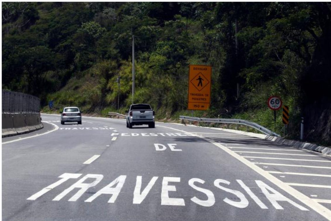
Rodovia dos Tamoios (foto de arquivo) enfrenta interdições nesta quinta-feira, 8 de novembro

SOROCABA - Três quedas de barreiras levaram à interdição completa da Rodovia dos Tamoios (SP-099), principal acesso às praias do Litoral Norte , na madrugada desta quinta-feira, 8. A rodovia Oswaldo Cruz (SP-125), outro acesso à região, também foi interditada.