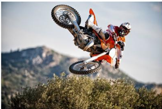
Novidade do evento em 2019 é arena freestyle

A programação completa foi divulgada nesta terça-feira (7)