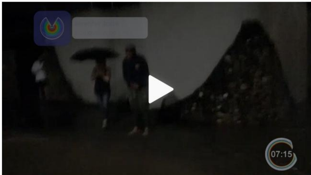
Chuva provoca alagamentos em Caraguatatuba

08/11/2018 08h38 · Atualizado há 20 minutos