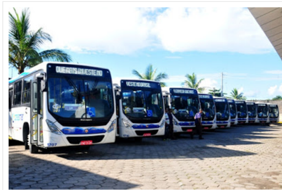
Motoristas cruzaram os braços na segunda-feira

Trabalhadores reivindicam 22% de aumento e Praiamar oferece 4%