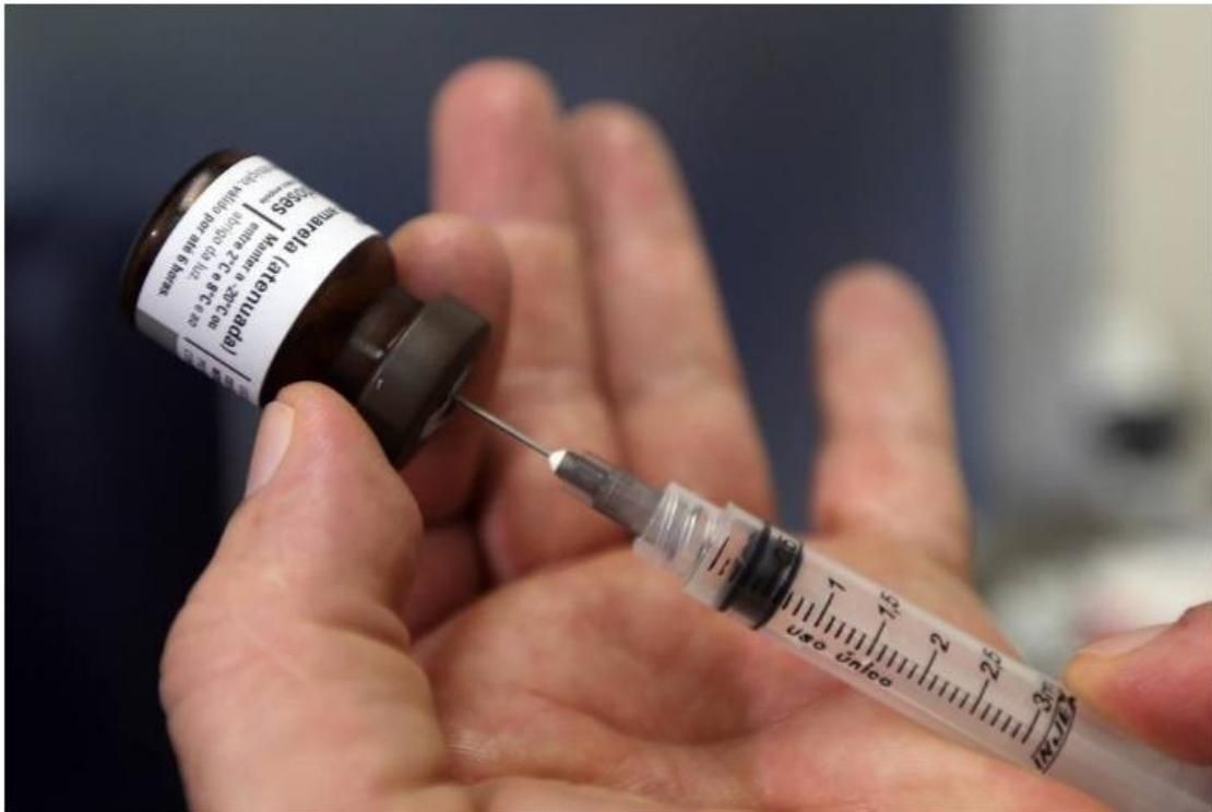
Vítima teria se recusado a tomar vacina

Desde o início de janeiro deste ano até o dia 23 de outubro, o Estado registrou 498 casos autóctones confirmados da doença. Destes, 172 evoluíram para óbito. Em todo o ano passado, foram 74 casos autóctones, com 38 mortes. Com a proximidade do verão, a febre amarela volta a preocupar, já que aumenta a procura pelas áreas de matas e cachoeiras, povoadas por mosquitos potencialmente transmissores da doença.