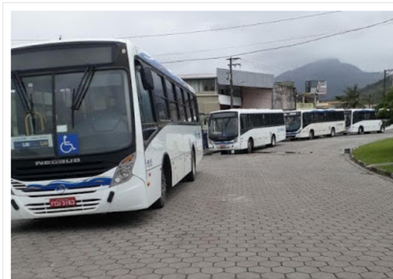
Pelo menos 40% da frota ficou parada hoje

Lei determina que 60% da frota permanecesse nas ruas por se tratar de serviço essencial, mas veículos foram depredados para não sair das garagens