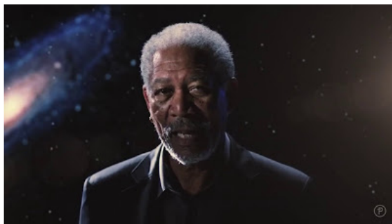
O episódio do filme será exibido hoje (5) no IFSP

Apresentação acontece no IFSP, no Indaiá