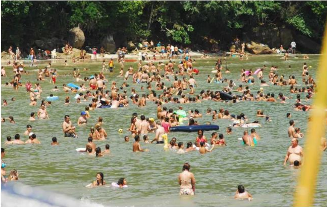
Turistas lotam praia em Caraguatatuba

O modelo de turismo é comum em Caraguatatuba, que está ligada a outras cidades do Litoral Norte. Apesar da regulamentação diminuir o fluxo de visitantes, a associação comercial de Caraguatatuba afirma apoiar a decisão do executivo.