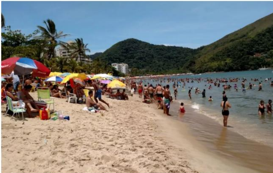
Se aprovada, medida vai passar a valer ainda nesta temporada de verão — Foto: André Luis Rosa