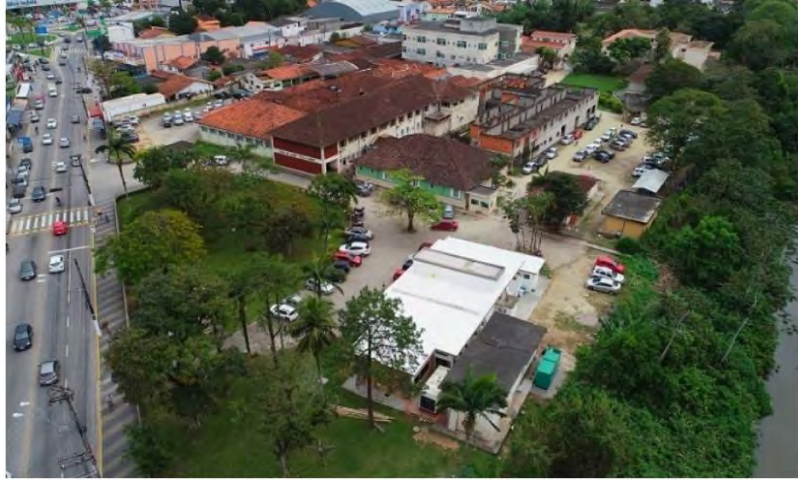
Ampliação de 54 leitos hospitalares na Casa de Saúde Stella Maris

A Prefeitura de Caraguatatuba confirmou mais uma morte e chegou a 35 decorrentes do novo coronavírus até essa quinta-feira (2). O número de pessoas já diagnosticadas com a doença na cidade chegou a 415.