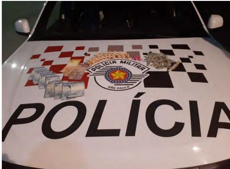
Drogas e dinheiro apreendidos apresentados no DP.

Na noite de terça-feira, dia 30, por volta das 21h, equipe da Polícia Militar do 20º Batalhão de Caraguatatuba, durante patrulhamento pelo bairro Reino, avistou dois homens em atitudes suspeitas, sendo que um deles segurava uma sacola enquanto fornecia algo ao outro em uma moto.