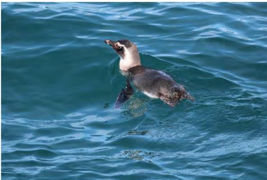
Pinguim-de-Magalhães é encontrado na praia das Anchovas, em Ilhabela (SP)

Segundo o Instituto Argonauta, parte dos pinguins perde grupo e acaba parando nas praias. Cansados, debilitados e com fome, muitos morrem antes de concluir uma jornada.