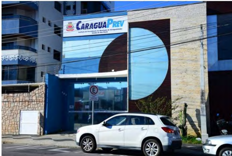
CaraguaPrev adotou as medidas impostas pelo governo federal

Reforma da previdência determinou aumento nos valores em todo o Brasil