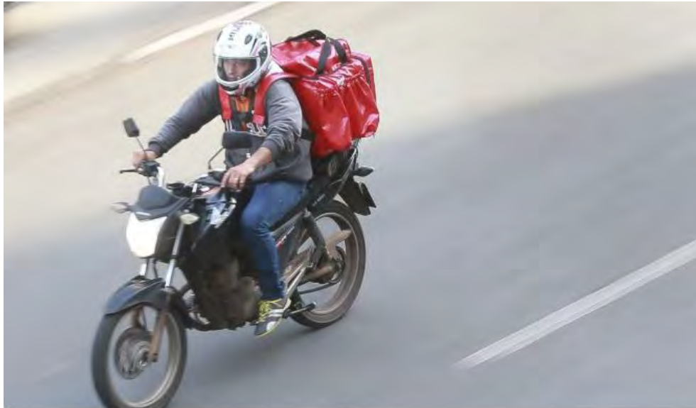
Motoboys e restaurantes continuam trabalhando em meio a crise do Covid-19

Com as sanções municipais e estaduais, que impõe quarentena, os serviços de entrega a domicílio não param de crescer