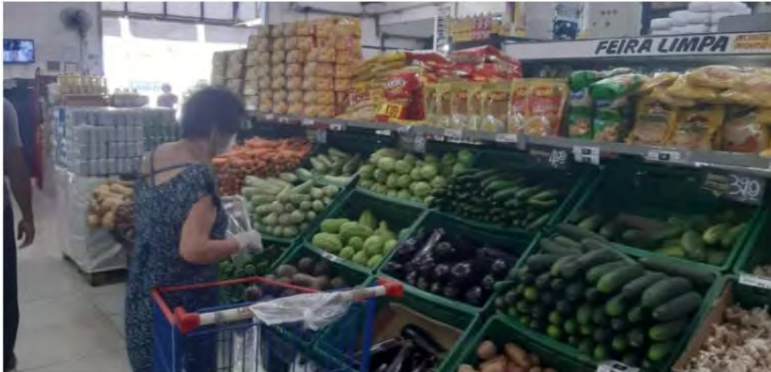
Senhora usa máscara e luvas em supermercado

Nas ruas e em estabelecimentos comerciais já é bem comum ver pessoas usando máscaras para se proteger do coronavírus. O álcool gel sumiu dos estabelecimentos, principalmente, supermercados e farmácias.