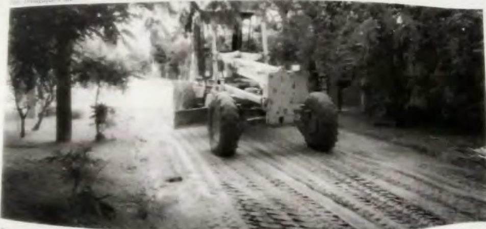
Caraguatatuba/ Da Redação

A Prefeitura de Caraguatatuba, por meio da Secretaria de Serviços Públicos (Sesep), realiza o nivelamento mecânico da Avenida Delfin no bairro Capricórnio, localizado