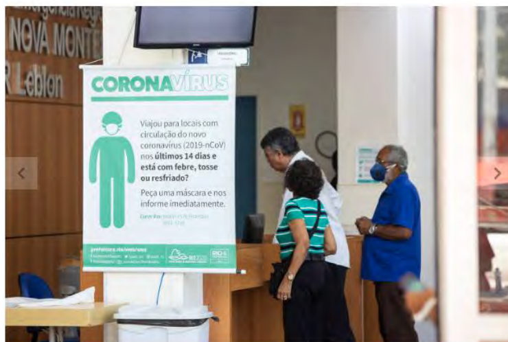
Hospital Municipal Miguel Couto tem mais demora para atender pacientes, no Leblon, Rio de Janeiro