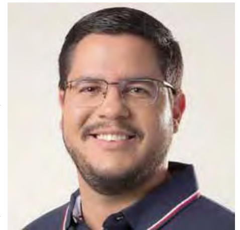
Teatro Mário Covas.

Além disso, a administração cancelou todos os eventos do calendário oficial e os que são apoiados pela Prefeitura, além de determinar o fechamento do MACC (Museu de Arte e Cultura de Caraguatatuba), Biblioteca, Videoteca Lúcio Braun, Auditório Maristela de Oliveira e