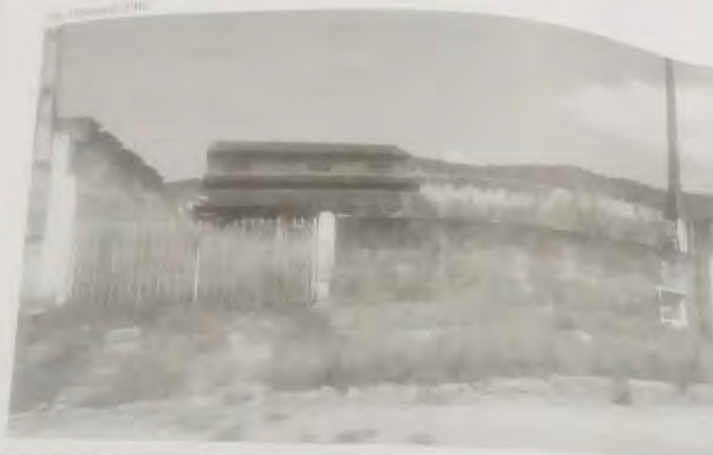
Caraguatatuba/ Da Redação