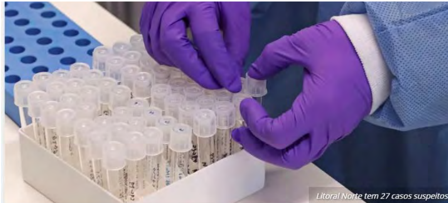
Litoral Norte tem 27 casos suspeitos

Os casos suspeitos de coronavírus continuam aumentando no Litoral Norte. Já são 25 casos em investigação. Não existe nenhum caso confirmado da doença nas cidades de Caraguatatuba, Ubatuba, São Sebastião e Ilhabela.