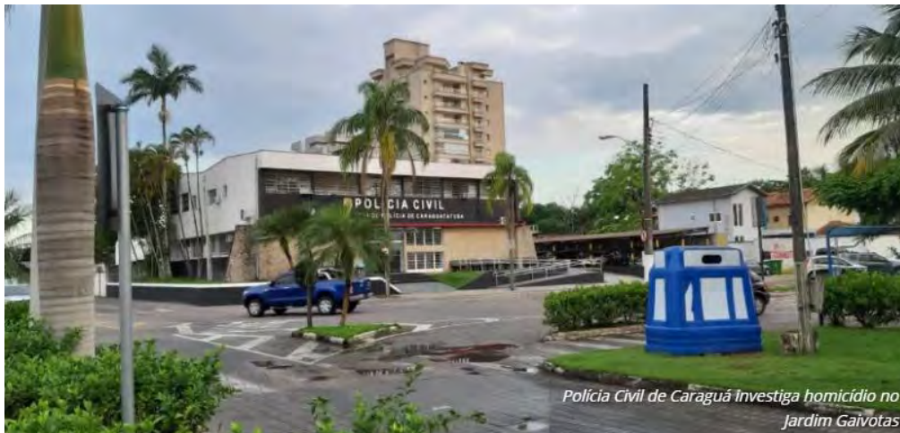
Polícia Civil de Caraguá Investiga homicídio no Jardim Gaivotas

O prefeito de Caraguatatuba, Aguilar Júnior, registrou boletim de ocorrência contra um internauta da cidade que postou ontem, segunda-feira(16), através do whatsapp, informações falsas sobre registros de seis casos positivos da doença na cidade.