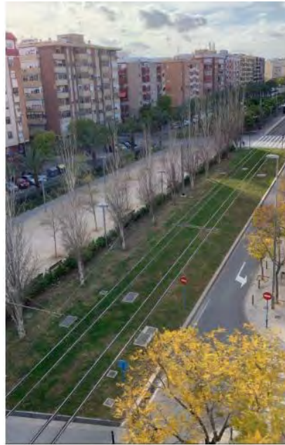
Ruas vazias sinônimo de quarentena

ele trabalha está fechada, os 15 dias de quarentena serão pagos pelo governo, mas não se sabe quanto tempo ainda até que o contágio seja controlado.