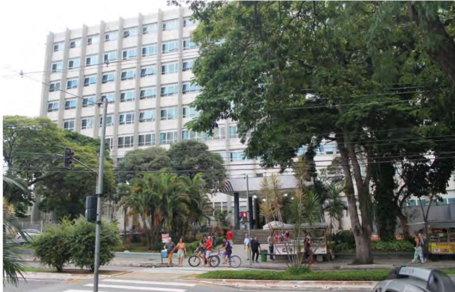
Regional. Taubaté tem 49 casos