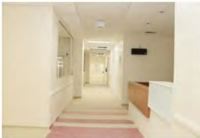
O prédio principal está finalizado

O Hospital Regional deveria ser concluído em 2018, mas por vários motivos a sua inauguração tem sido adiada. A informação é que o hospital será inaugurado em abril. A construção teve início em 2016 e foram investidos R$188 milhões, financiado com verba do Banco Interamericano de Desenvolvimento (BID). O hospital tem 200 leitos, sendo 40 de UTI, 20 de observação e 16 para hospital dia. O Instituto Sócrates Guanaes venceu a licitação para administrar o hospital e finaliza a contratação de funcionários.