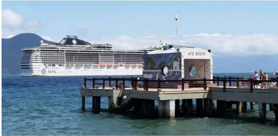
Navios de cruzeiros impedidos de atracar na Ilha

Outra medida adotada pela prefeitura da Ilha, em parceria com a Dersa, foi reduzir o número de passageiros nos catamarãs. As embarcações que podem transportar até 400 passageiros, só poderão transportar 50(LS-02) e 70 a LS-05.